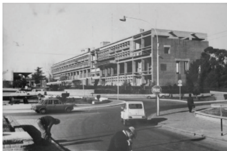
Figura 5: Centro Cívico de Santa Rosa, La Pampa.