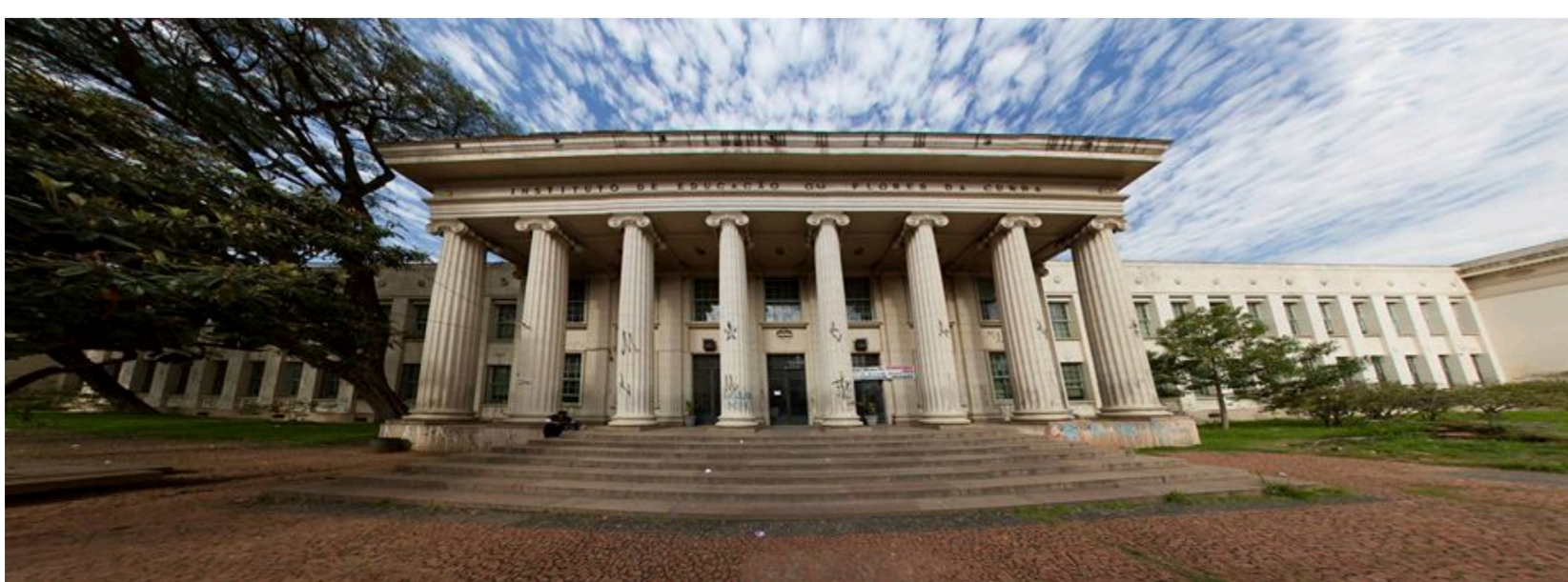
Figura 1. Instituto de Educação Flores da Cunha. Local de realização das oficinas.

Esperamos com o resultado observar se houve crescimento no nível de aprendizagem dos alunos e, se houver, medir o quanto esse nível aumentou. Havendo aumento, a oficina poderá ser ministrada em várias escolas públicas e replicada por diferentes professores, agregando conhecimento aos alunos de uma forma alternativa que chama mais atenção para eles.