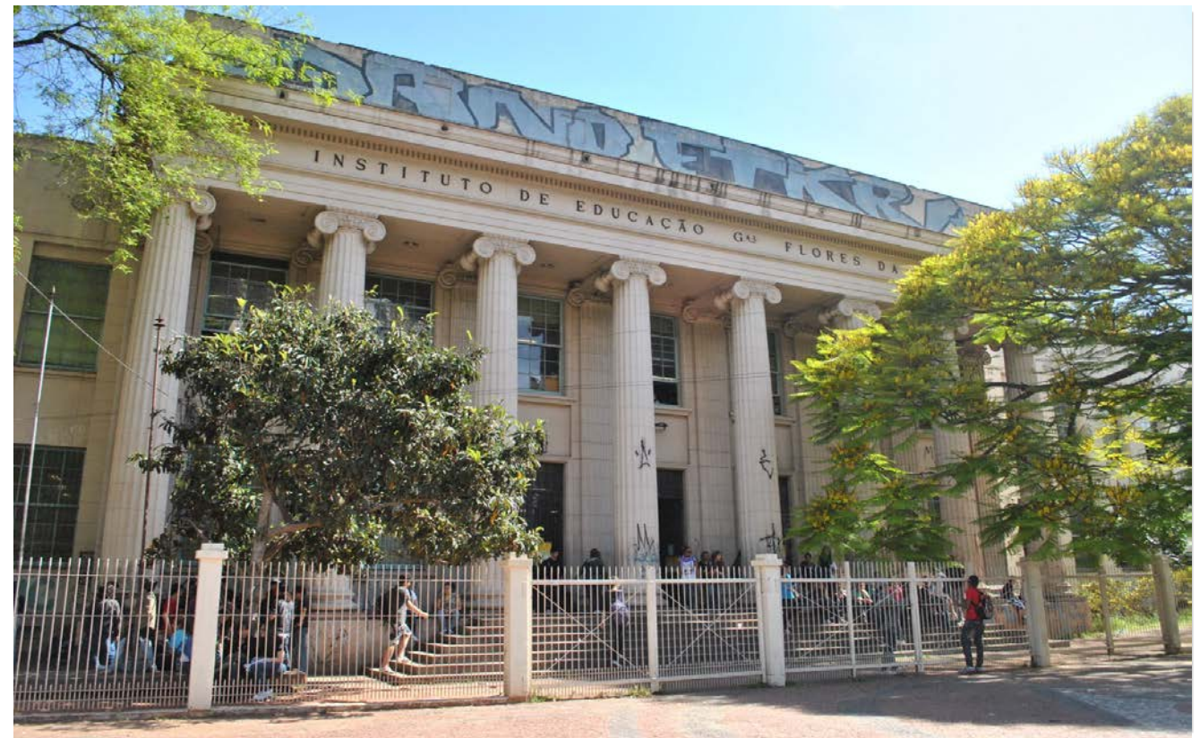
Figura 1: Fachada do Centro Estadual de Formação de Professores General Flores da Cunha

Sensibilizar os alunos sobre riscos do uso de agrotóxicos e qualificar os graduandos em licenciatura para posterior atuação no ensino público.