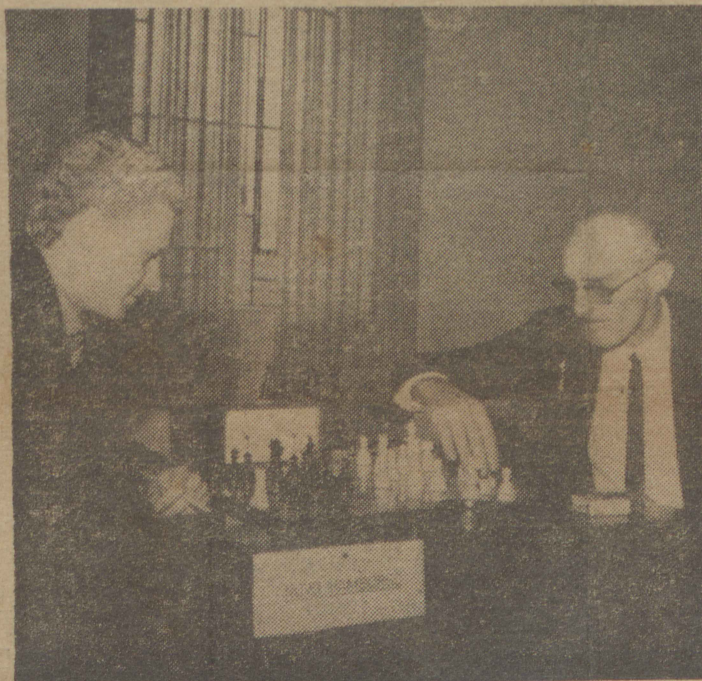
Santa Maria assiste e vibra com os II Jogos Inter Municipais. Em todas as frentes o entusiasmo é enorme, atestando o sucesso desta promoção do Departamento de Esportes do Estado, que recebe integral apoio da sociedade esportiva de todo o Estado