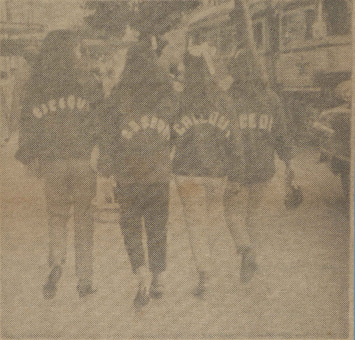
Santa Maria assiste e vibra com os II Jogos Inter Municipais. Em todas as frentes o entusiasmo é enorme, atestando o sucesso desta promoção do Departamento de Esportes do Estado, que recebe integral apoio da sociedade esportiva de todo o Estado