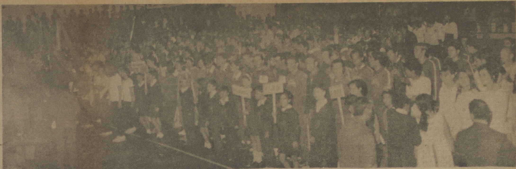
Constituiu-se em ponto alto o desfile inaugural das delegações que participam dos II Jogos Inter Municipais. O santa-mariense começou a vibrar no pano-de-amostra do magno torneio esportivo