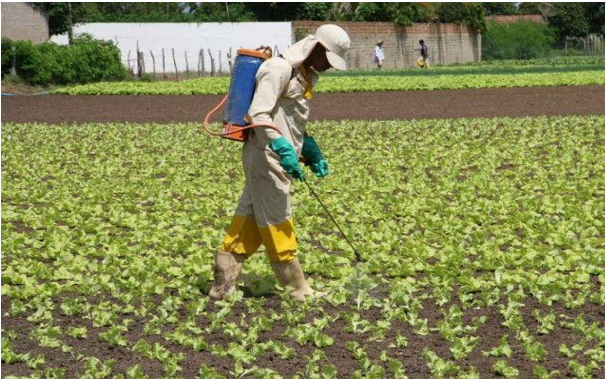
Figura 1: Aplicação de agrotóxico em verduras.

Segundo Carson (1962), em seu livro Primavera Silenciosa os agrotóxicos começaram a ser desenvolvidos a partir da década de 40 nos Estados Unidos da América. Cerca de 200 substâncias químicas diferentes foram desenvolvidas com o objetivo de auxiliar os produtores na eliminação de plantas indesejáveis, insetos, roedores e outros organismos vivos encontrados nas lavouras. Os agrotóxicos se difundiram no mundo todo através da cooperação internacional e por um processo desenvolvimentista induzido pela hegemonia americana. A figura abaixo mostra um produtor realizando a aplicação de agrotóxicos em verduras: