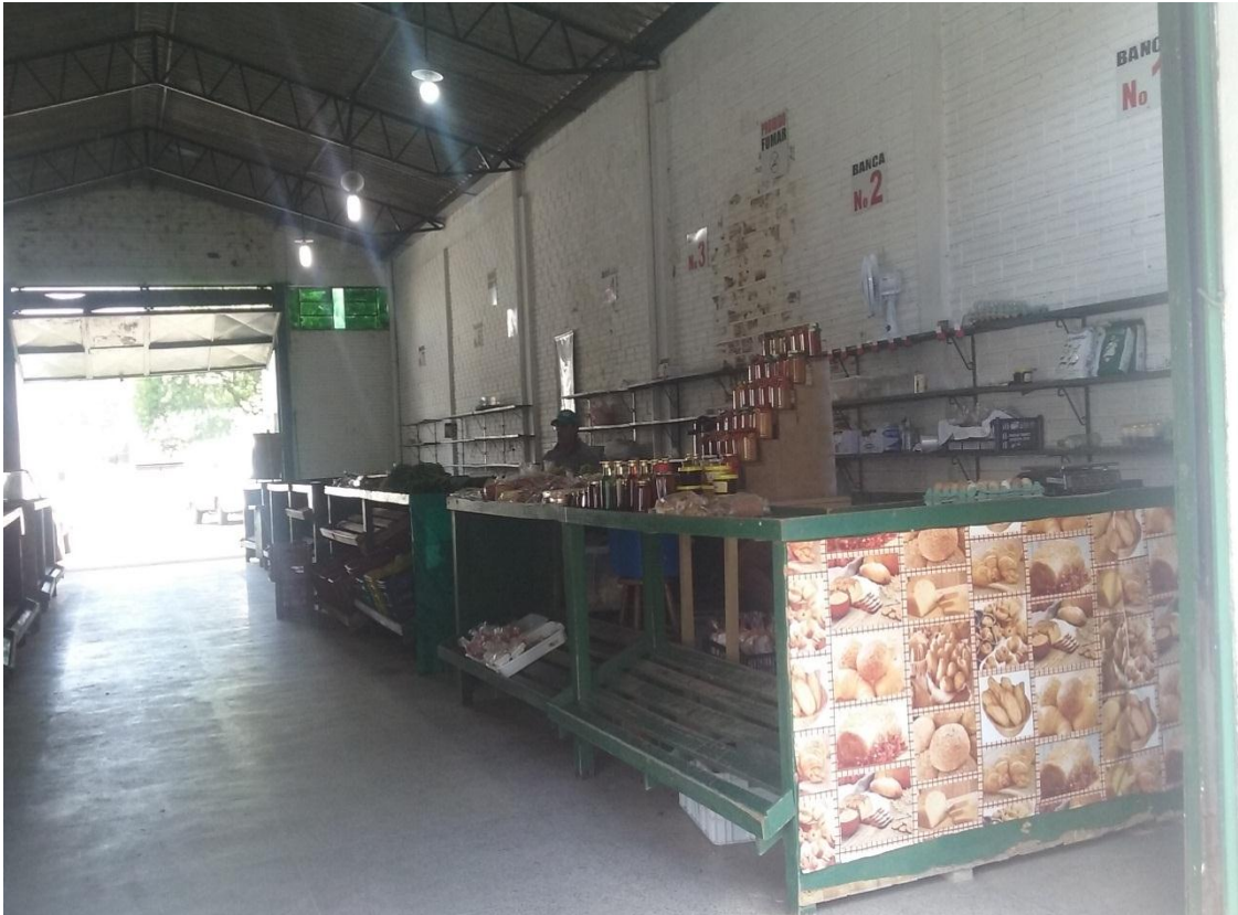
Figura 4: Feira Livre da Agricultura Familiar de Taquara.