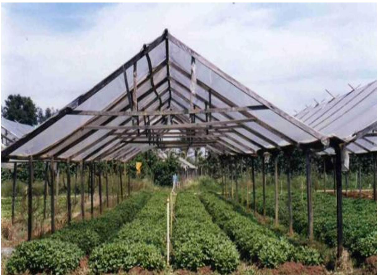
Figura 5: Estufas para plantio de hortaliças com as laterais abertas.

Na figura abaixo podemos ver o modelo simples de estufa construído pelos produtores da agricultura familiar onde são cultivadas principalmente as foliosas mais susceptíveis ao ataque de fungos.