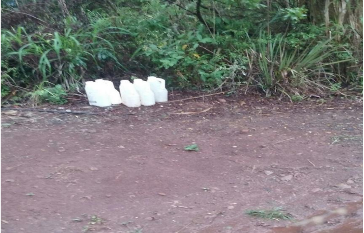
Figura 7: Embalagens de agrotóxicos usadas para transportar água.