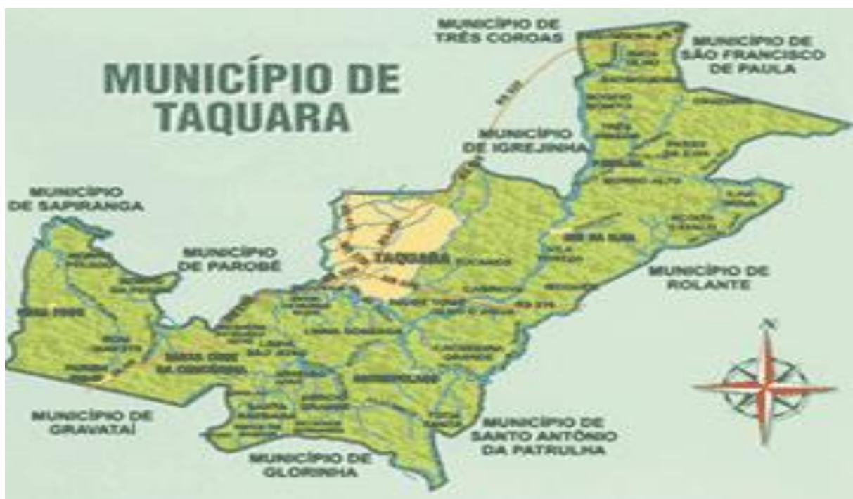
Figura 2: Localização do Município de Taquara.

O Município de Taquara onde foi realizada a pesquisa de campo está localizado na Encosta Inferior da Microrregião Colonial da Encosta da Serra Geral, distante 72 Km de Porto Alegre, 40 Km de Gramado e 40 Km de São Francisco de Paula. O Município de Taquara faz a ligação entres os municípios da grande Porto Alegre e da Serra, tornando se assim um centro de passagem dos turista que vão tanto para Gramado com para São Francisco de Paula.