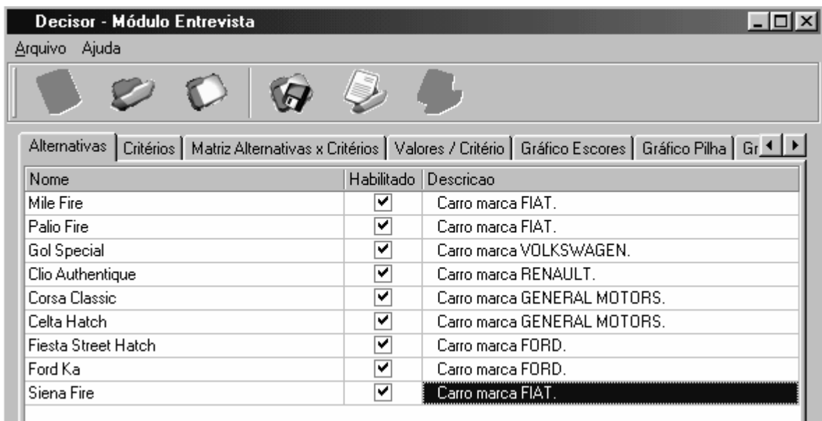
Figura 2 – Tela inicial do sistema Decisor

Nesta tela inicial o usuário pode observar as alternativas que compõem a problemática de decisão proposta e também pode desabilitá-las ou habilitá-las. Esta função foi incluída para atender a estratégia de decisão fundada na eliminação por aspectos, na qual o tomador de decisão rejeita todas as alternativas com aspectos que não satisfazem um mínimo aceitável, inicia com o atributo mais relevante e escolhe uma das alternativas remanescentes (HARTE et al., 1994).