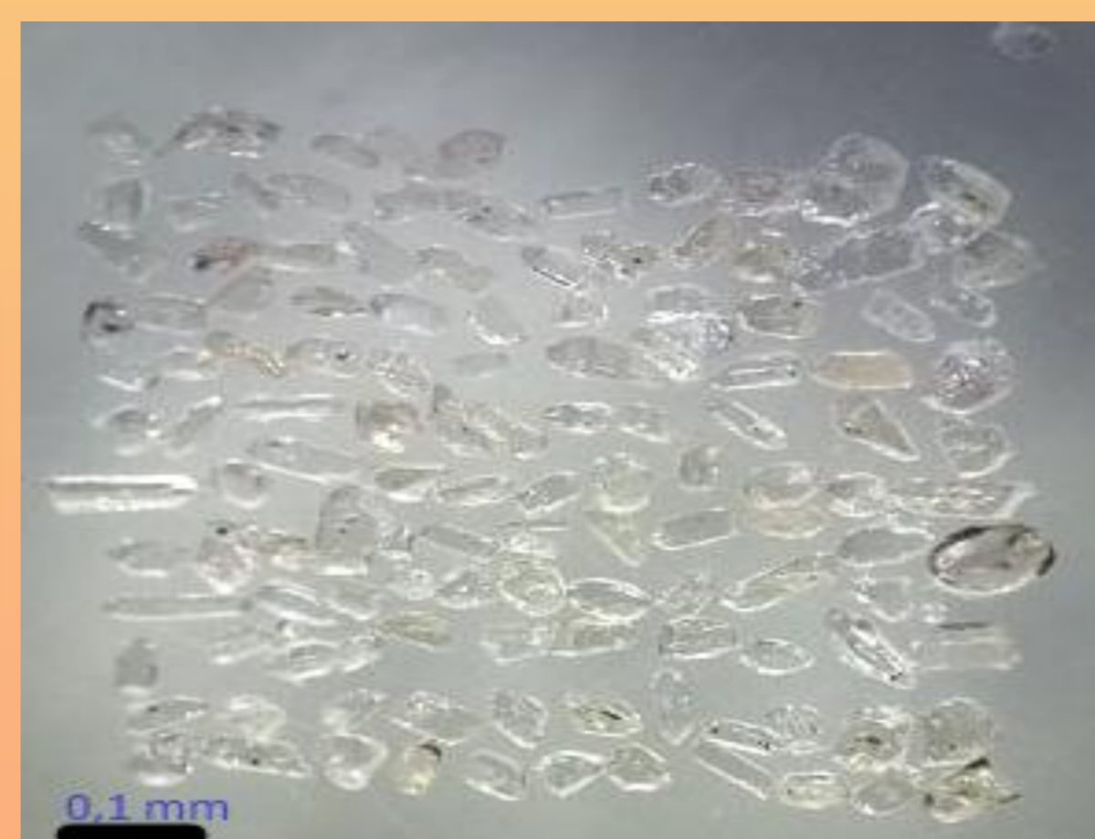
Figura 1: Imagem da montagem de zircões na pastilha, vista da Lupa Binocular.

3.2 As idades são obtidas em um espectrômetro de massa (ICP-M) acoplado a um laser. A Ablação a Laser consiste na interação de fótons de alta intensidade com o material sólido, os spots onde será direcionado o laser são definidos pelo método anterior e os dados gerados permitem datar as idades dos grãos (Figura 3).