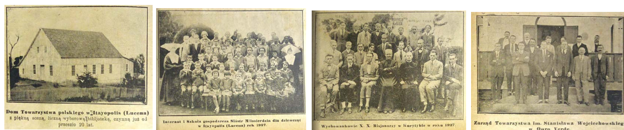
Kalendarz Ludu, 1928 - As escolas, congregação feminina, os alunos missionários e os professores

Até setembro de 2019, a pesquisa identificou informações sobre as agremiações educativas Kultura e Oswiata em diferentes documentos: almanaques em polonês impressos no Brasil, como o Kalendarz Ludu; documentos impressos por essas duas instituições; relatórios de imigração; documentos consulares; artigos de memorialistas e pesquisadores diversos. Frente ao inventário geral da existência de mais de 8 mil documentos impressos que constam no acervo da Sociedade Polônia, a pesquisa não esgotou a consulta a todos os documentos que possam conter pistas da experiência histórica dessas agremiações.