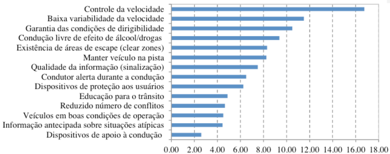
Figura 4: Gráfico de Pareto das importâncias ponderadas aos requisitos de segurança – Ireq_i

IS_i : impacto do requisito Y_i na redução da severidade do acidente.