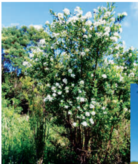
Nome científico: Escallonia bifida Família: ESCALLONIACEAE Altura: de 2 a 3 m

O canudo-de-pito é um arbusto muito ramificado, de copa globosa e folhagem persistente, ou seja, com folhas perenes. Possui folhas simples, verde-escuras e brilhantes na face superior e mais claras na inferior.