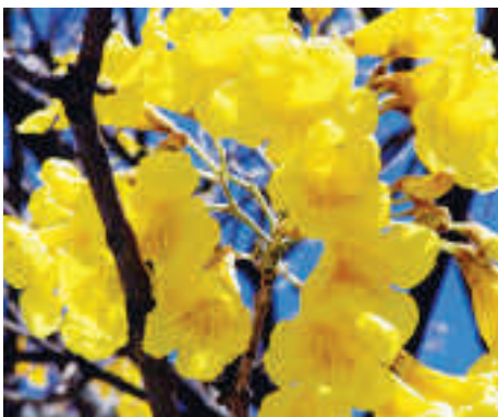
Nome científico: Tabebuia alba Família: BIGNONIACEAE Altura: de 20 a 30 m