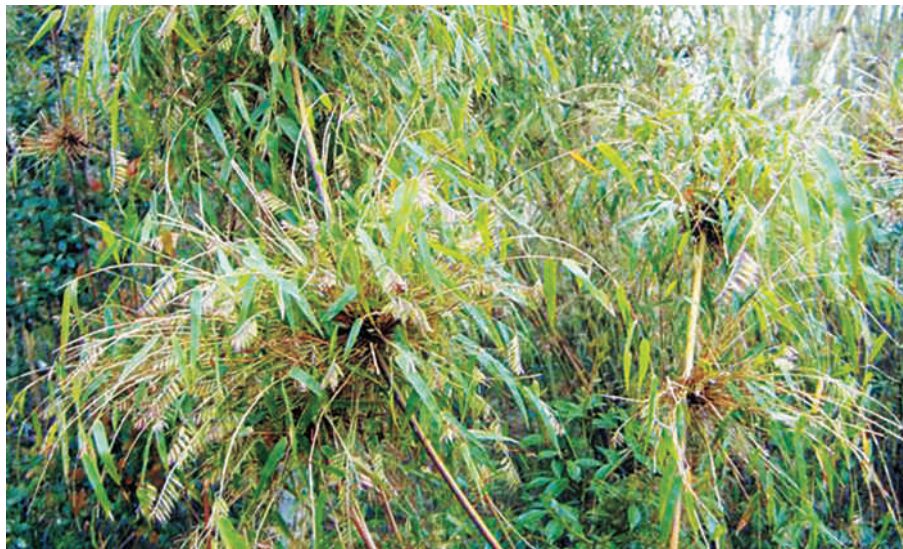
Detalhe das inflorescências.