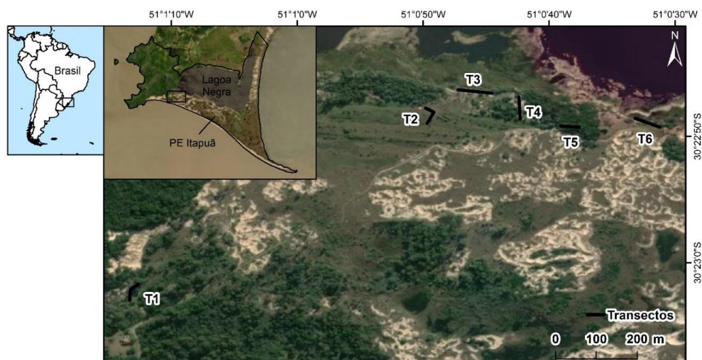
Figura 1. Mapa do Parque Estadual de Itapuã, Rio Grande do Sul, Brasil, indicando os transectos (linhas pretas, T1 a T6) na área de restinga estudada.

borboleta visitando um indivíduo florido, foi feita a coleta com a rede entomológica. As borboletas coletadas foram acondicionadas em envelopes e levadas para laboratório para posterior montagem. Caso não fosse possível ou não houvesse necessidade de coleta (pela identificação em voo) as espécies eram apenas registradas em planilha de campo. A identificação das espécies foi feita no local ou em análise posterior com o uso de guias de identificação. Os indivíduos florais foram fotografados para posterior identificação por especialistas.