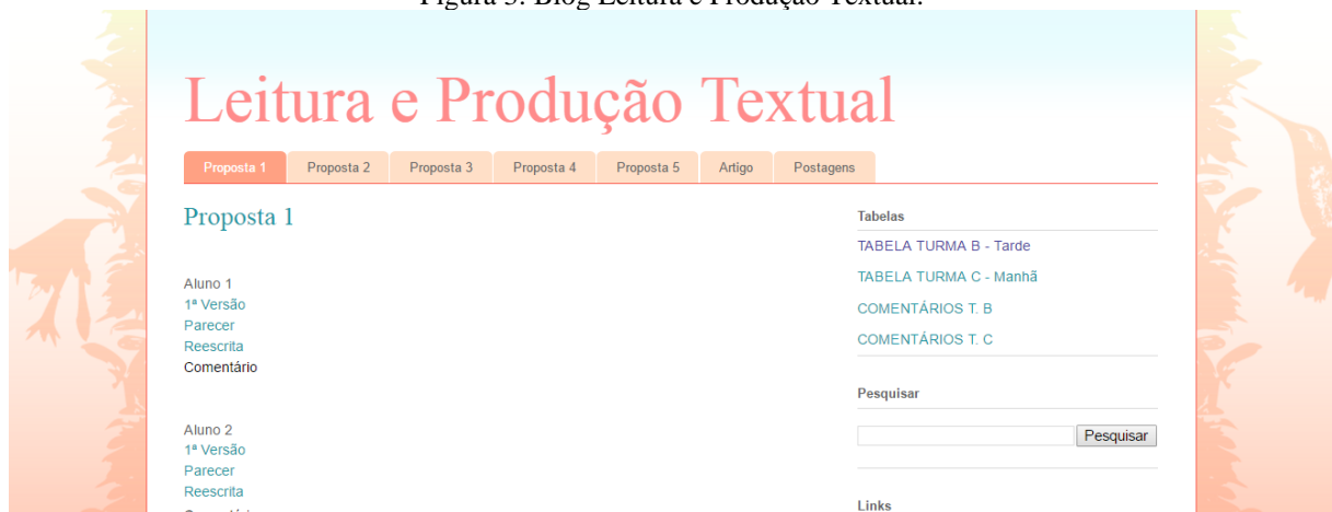
Figura 3: Blog Leitura e Produção Textual.