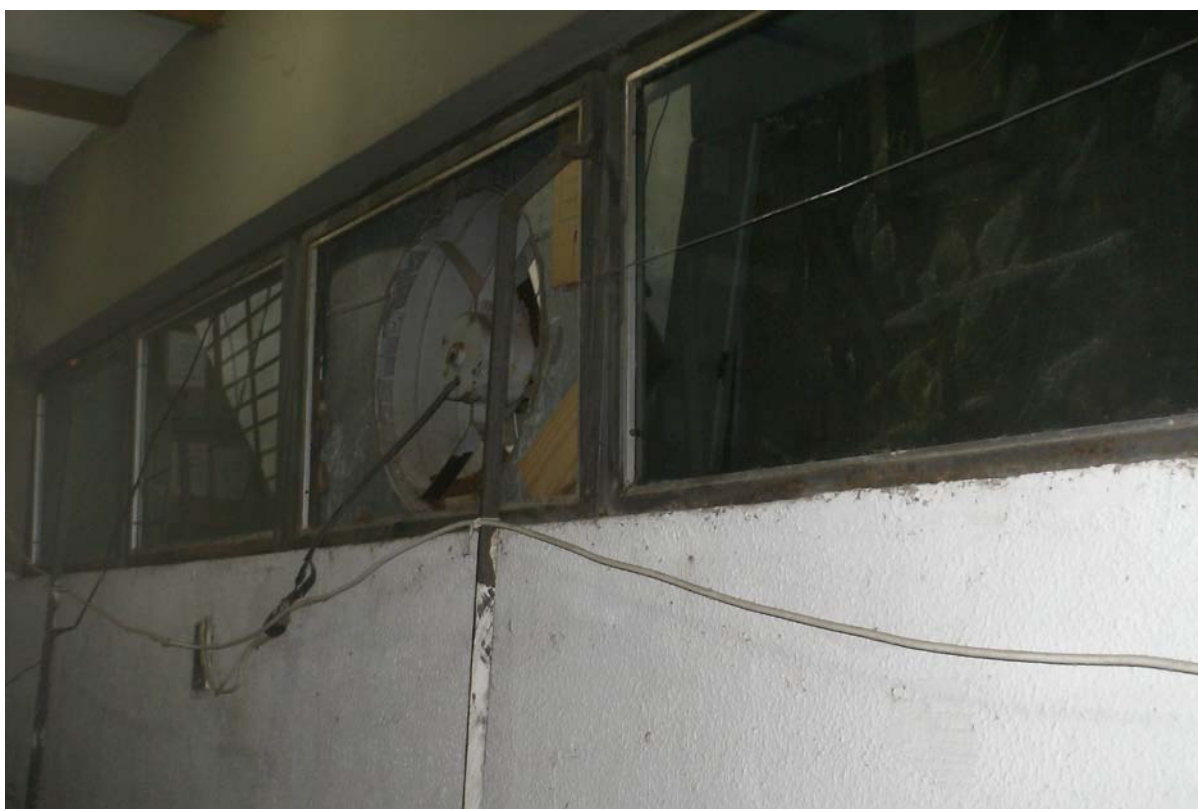
Figura 2 - Condições de climatização do arquivo municipal