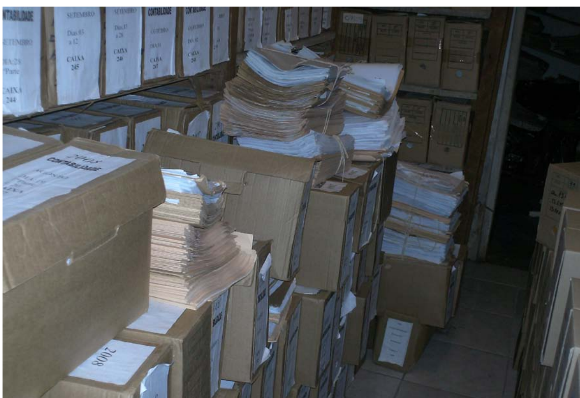
Figura 4 – Massa documental acumulado do arquivo municipal