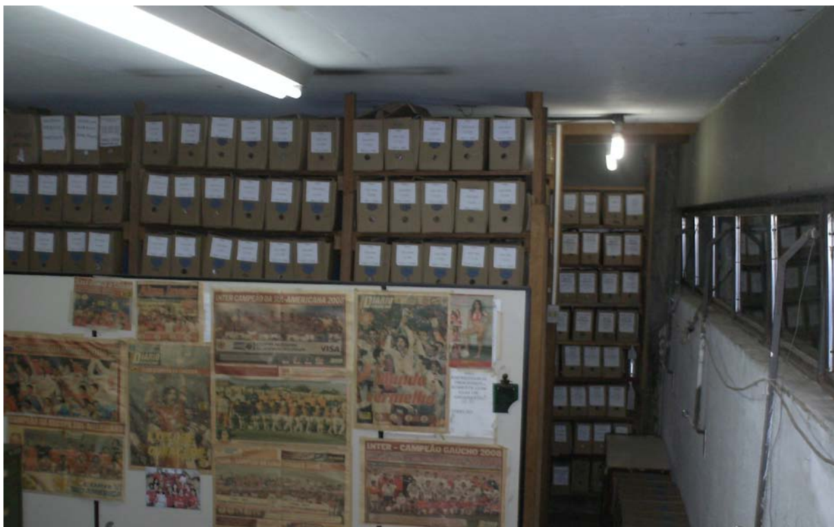
Figura 1- Espaço físico do arquivo municipal