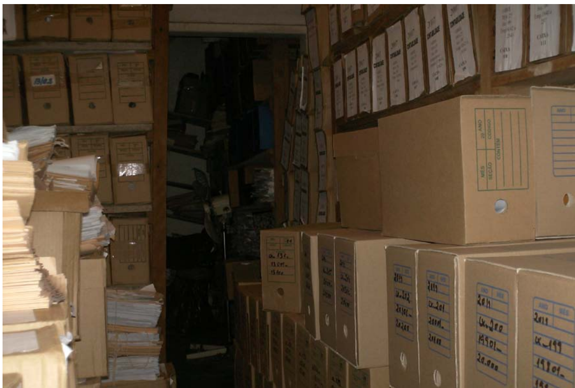
Figura 3 - Condições de higiene do arquivo municipal