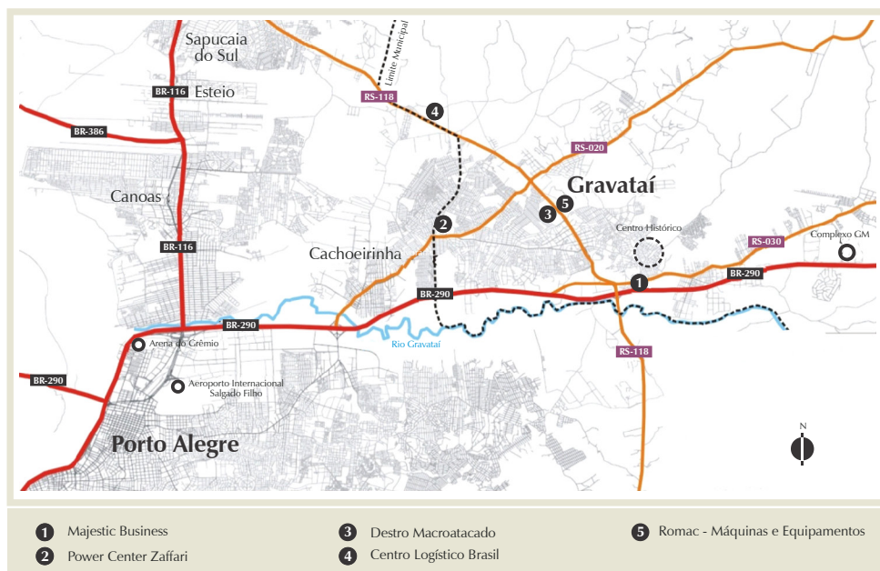
FIGURA 2 - LOCALIZAÇÃO DOS CINCO EMPREENDIMENTOS TERCIÁRIOS EM GRAVATAÍ E DE PONTOS REFERENCIAIS AO EIXO LESTE-OESTE DA REGIÃO METROPOLITANA DE PORTO ALEGRE