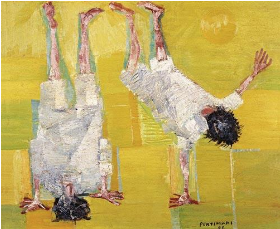
Figura 5 – Cambalhota – Portinari, 1958