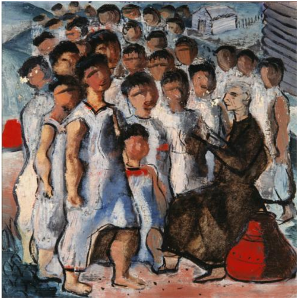
Figura 3 – Catechesis – Portinari, 1941