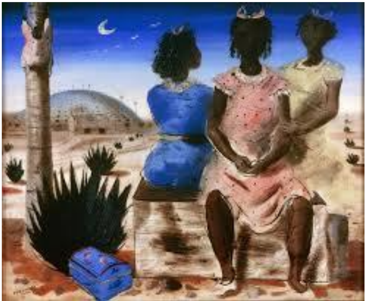
Figura 2 – As moças de Arcozelo – Portinari, 1940.