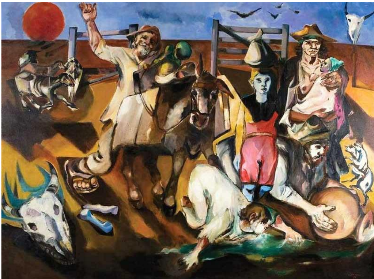
Figura 6 – A Descoberta da Terra – Portinari, 1941