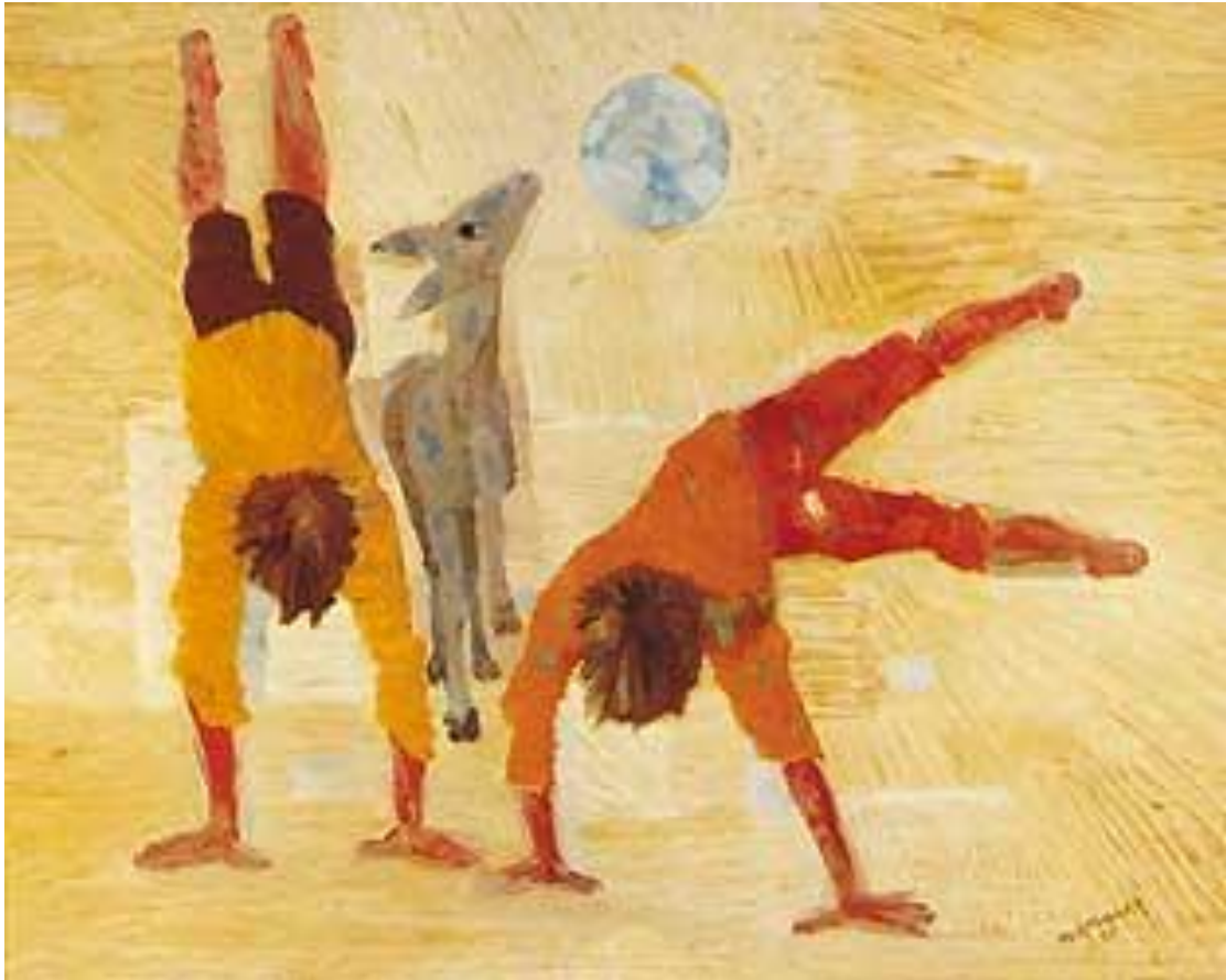
Figura 4 – Meninos Brincando – Portinari, 1955