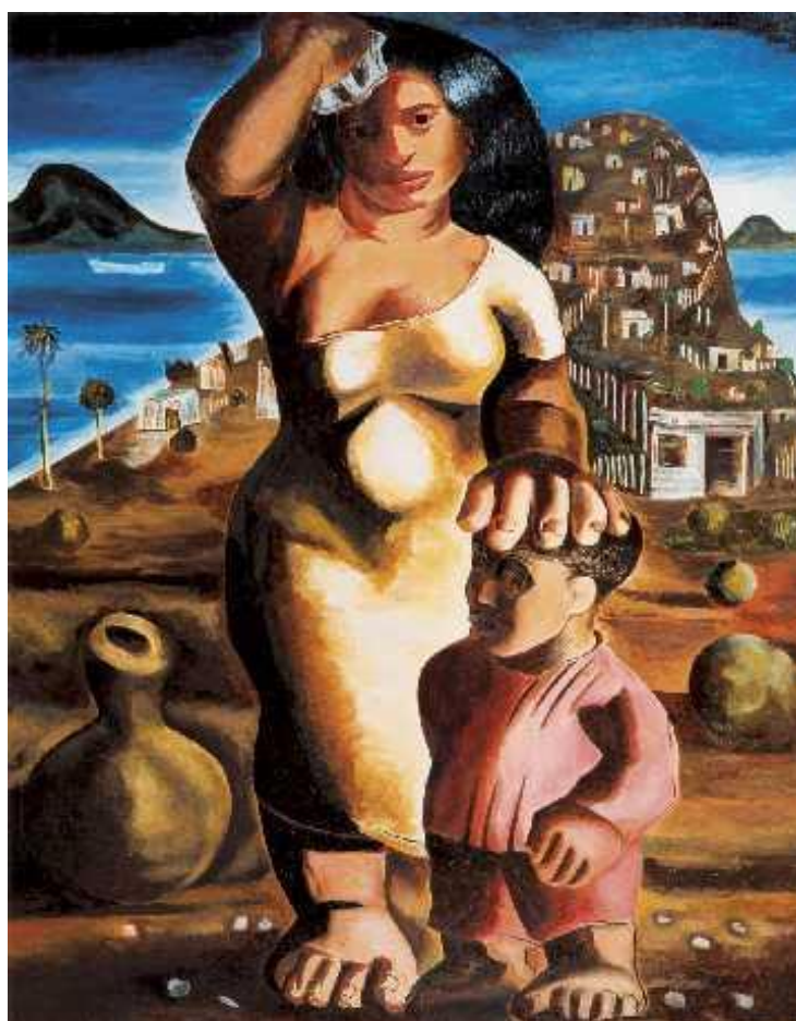
Figura 1 – Mulher com Criança – Portinari, 1936