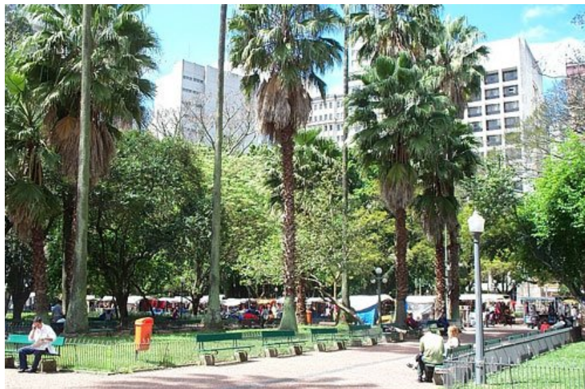
Figura 04: Praça da Alfândega: “Espaço e cotidiano” .

posteriormente na seção que se refere exclusivamente sobre a linha metodológica dessa investigação.