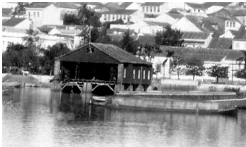
Figura 05: Trapiche da Guardamonia em 1892.