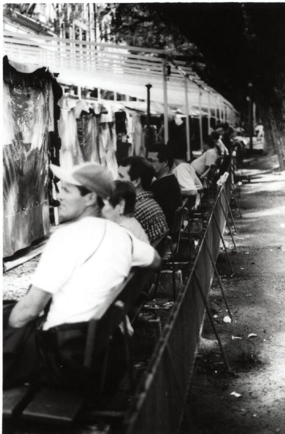
Figura 02: Montagem da Feira do Livro: “O espaço e o ócio.” - Nesta foto a maioria das pessoas estão desempregadas e observam a montagem da Feira do Livro de Porto Alegre que ocorre anualmente na Praça da Alfândega.