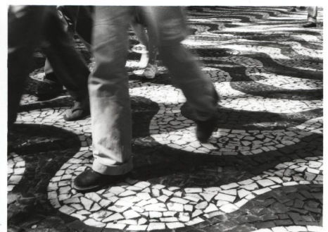
Figura 01: Calçadão da Rua dos Andradas frente a Praça da Alfândega - Porto Alegre/ RS : “O caminhar na cidade”.