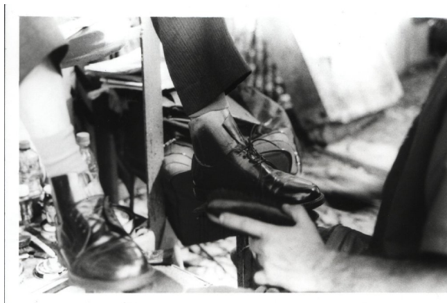
Figura 25: Engraxate da Praça da Alfândega. - Fotografado em outubro de 2005, pode se reparar que o relato de Athos Damasceno de 1940 traduz uma realidade ainda vivida no cotidiano deste lugar.