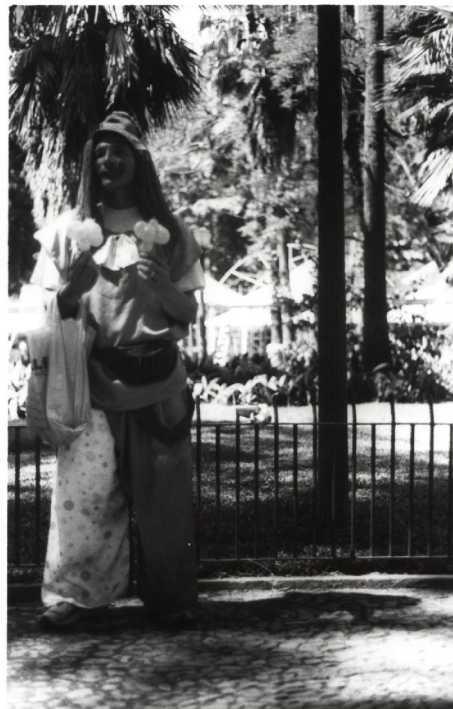
Figura 24: Artista de rua. – Trabalha eventualmente no local, utilizando como estratégia de venda a abordagem para oferecer seu trabalho. Enquanto fazíamos nosso trabalho fotográfico fomos abordados por ele.