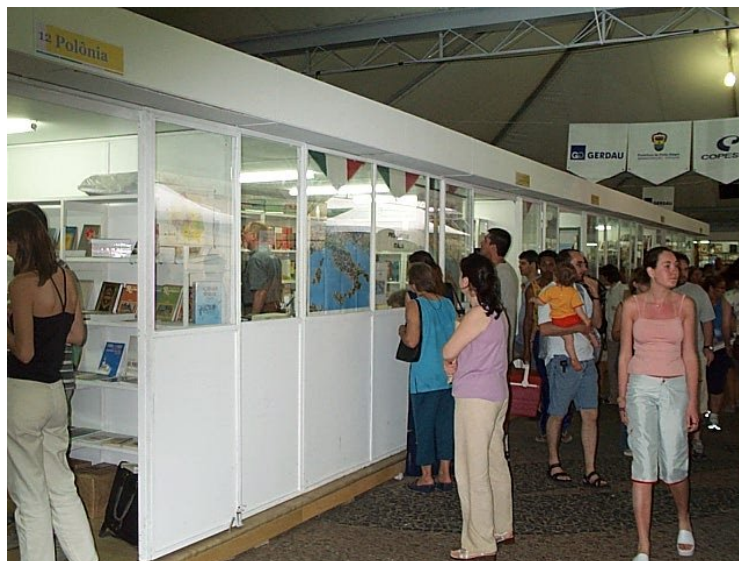
Figura 10: Feira do Livro de Porto Alegre: Vista de uma parte das alas externas.