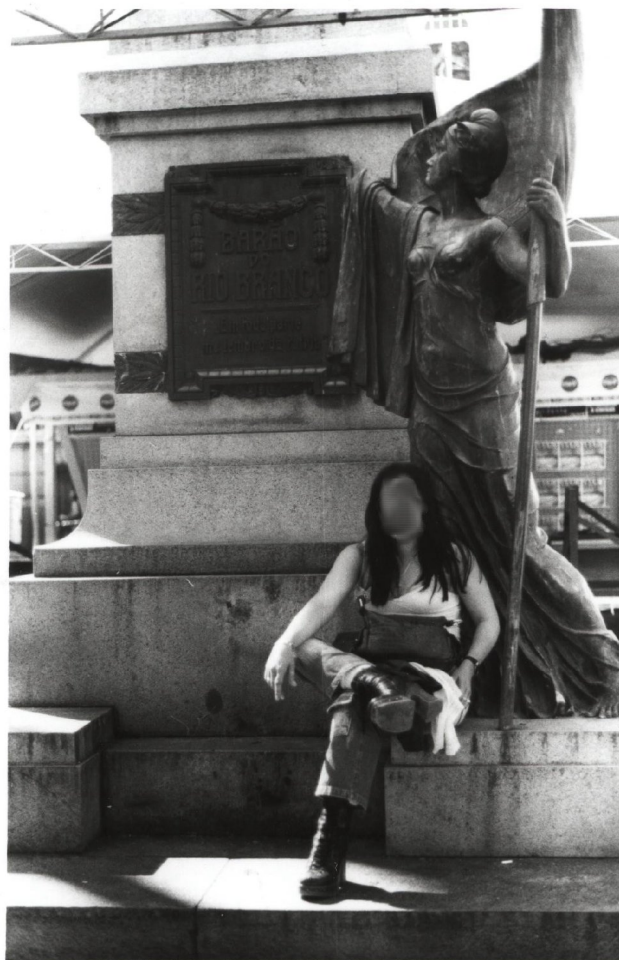
Figura 27: Prostituição na Praça da Alfândega: “Mulheres na praça”. - Intitulei essa fotografia com este nome, justamente pela presença da figura da mulher prostituta sentada 32 aos pés do símbolo feminino do monumento que representa a República.