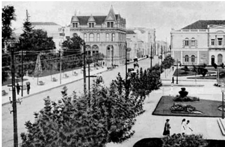
Figura 07: Praça da Alfândega em 1920.

ao redor da Praça da Alfândega que vão conferir a ela um ar de modernidade e conseqüentemente para a área central da cidade de Porto Alegre.