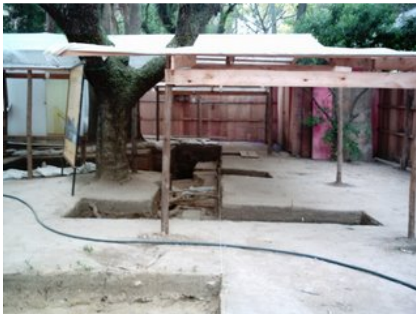
Figura 17: Escavações no terreno da Praça da Alfândega: “ Em busca do passado ”.

A seguir algumas fotos das escavações arqueológicas: