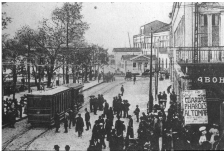
Figura 06: Praça da Alfândega em 1910 (chamada na época de Senador Florêncio).

residirem nos sobrados, acima das próprias lojas”.