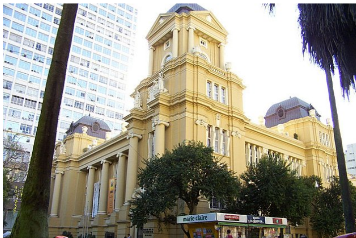
Figura 14: Museu de Arte do Rio Grande do Sul – MARGS.