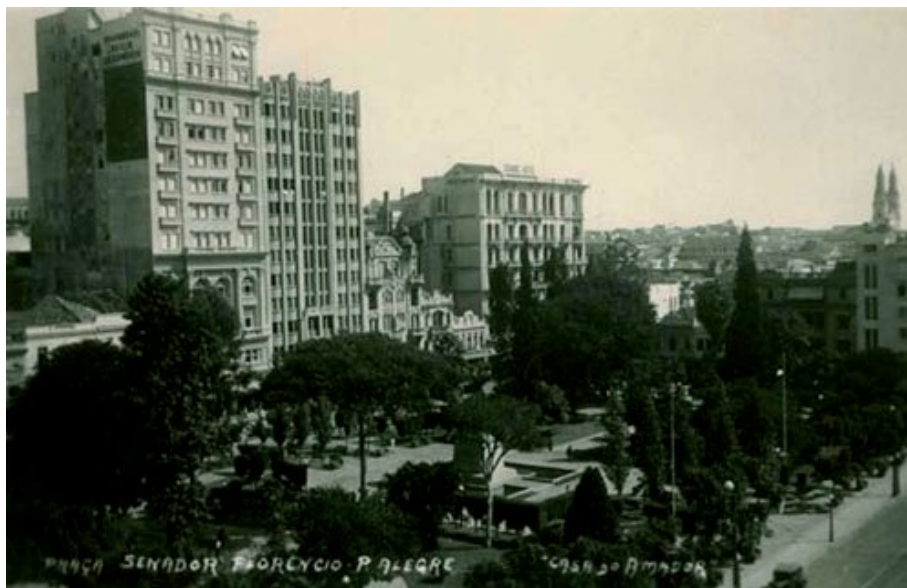
Figura 09: Praça da Alfândega nos anos 40.