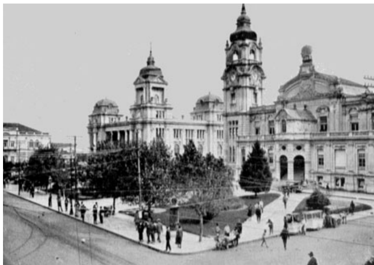
Figura 08: Praça da Alfândega em 1925.