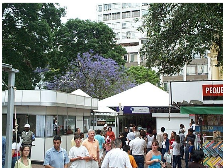
Figura 11: Feira do Livro de Porto Alegre: Ala coberta com editores de outros países.