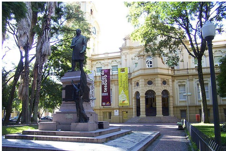
Figura 12: Memorial do Rio Grande do Sul.

A seguir os respectivos prédios mencionados: