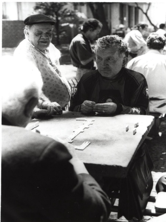
Figura 21: Jogadores de dominó na Praça da Alfândega. - Pode se perceber o predomínio dos idosos nas mesas de jogo da praça.

“O tempo aqui passa voando (...). Freqüento estas mesas há oito anos. Este lugar é onde encontro meus companheiros de jogo. Eles estão todos os dias aqui, menos quando está chovendo. Ficamos até a noite (...) até não ver mais as pecinhas do tabuleiro”.