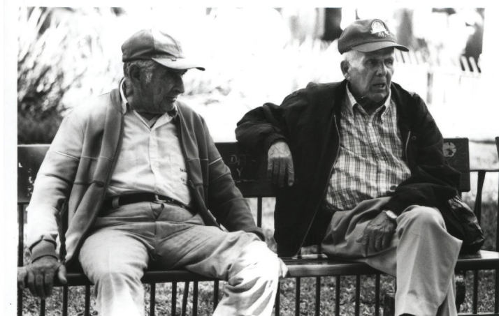
Figura 19: idosos conversando em um dos bancos da Praça da Alfândega: A praça como um espaço do estar-junto à toa.

Numa outra percepção pode-se observar na figura 19 flagrada no trabalho fotográfico de campo (mencionado anteriormente na metodologia), onde se nota os dois idosos conversando sentados a um banco da Praça da Alfândega. O que se pode destacar como relevante é o fato que durante a execução da pesquisa inúmeras vezes os mesmos foram observados no mesmo local, ocupando inclusive o mesmo banco. A idéia que Maffesoli traz que é, justamente, o de estar-junto à toa é refletida claramente nesta foto. Maffesoli (1987, p.115) afirma que a “comunicação, ao mesmo tempo , verbal e não verbal, constitui uma vasta rede que liga os indivíduos entre si.”