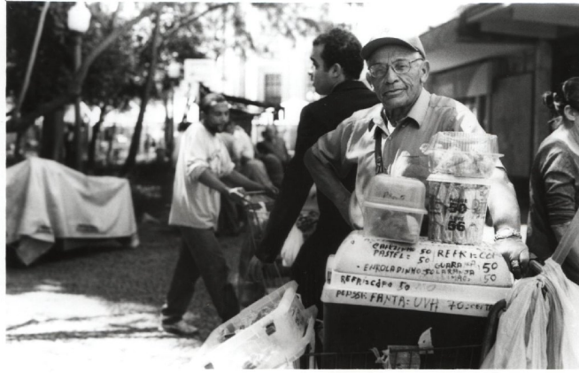
Figura 23 : Vendedor Ambulante. – Trabalha no local há décadas, seus principais clientes são os jogadores de damas e dominós e os engraxates.