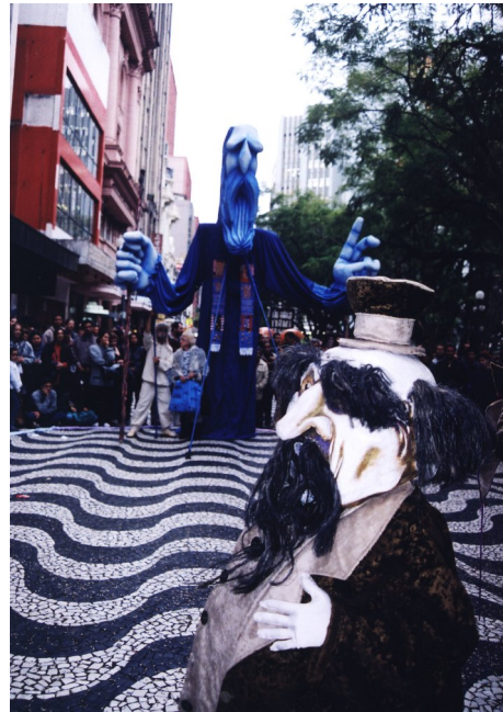
Figura 15 e Figura 16: “A Saga de Canudos”. Apresentado na Praça da Alfândega pelo grupo de atadores do “Ói Nós Aqui Traveiz”.