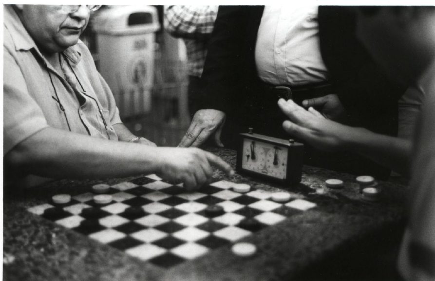
Figura 20: Jogadores de dama. - Pode-se perceber que estes jogadores utilizam peças de damas originais e não improvisadas como os demais, e até um cronômetro para as partidas.

Geralmente formados por aposentados, moradores de rua e desempregados, os jogadores de damas e dominós utilizam cotidianamente este espaço para a ludicidade e também para a prática do convívio com outros indivíduos que lá se estabelecem com a mesma finalidade. Como se pode perceber na figura 20: