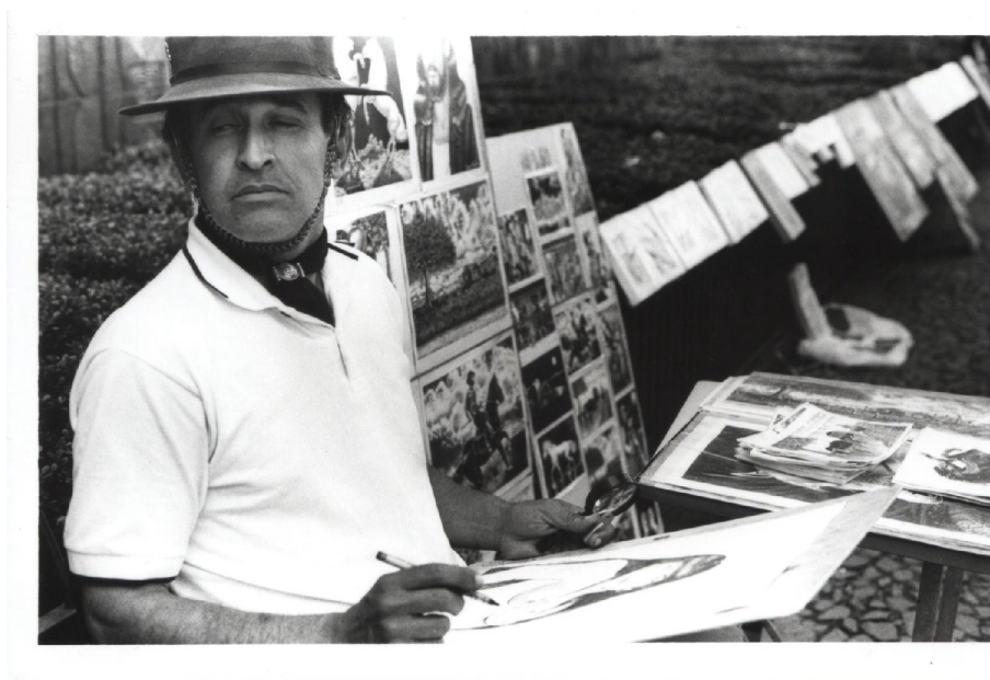
Figura 22: Artista de rua. – Nesta foto procurou-se buscar um pouco do dia-a-dia de trabalho deste artista, que muito se “orgulha” de suas obras, que conforme ele vende para várias lojas do estado.

Todos essas formas de trabalho convergem em práticas sociais estabelecidas nesse espaço com o intuito obter recursos financeiros para sobrevivência material. Esses fragmentos do cotidiano desses agregados podem ser verificados em algumas fotos a seguir: