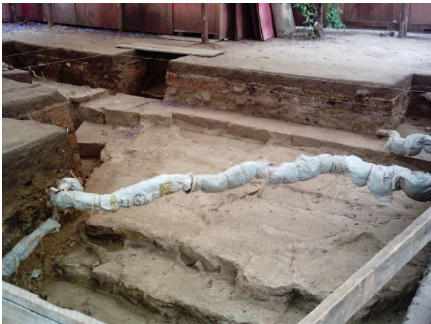
Figura 18: Parte das escadarias do antigo cais: “ Em busca do passado ”.