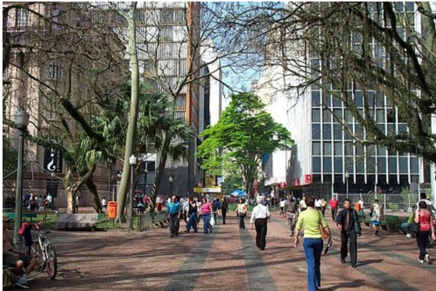
Figura 03: Praça da Alfândega: “ Um espaço público. ” - Percebe-se nesta foto claramente seu caráter público principalmente baseado no aspecto da livre circulação dos cidadãos e da sua diversidade.

complexo e dinâmico que conformam uma relação direta entre “a configuração física, seus usos e sua vivência efetiva”.