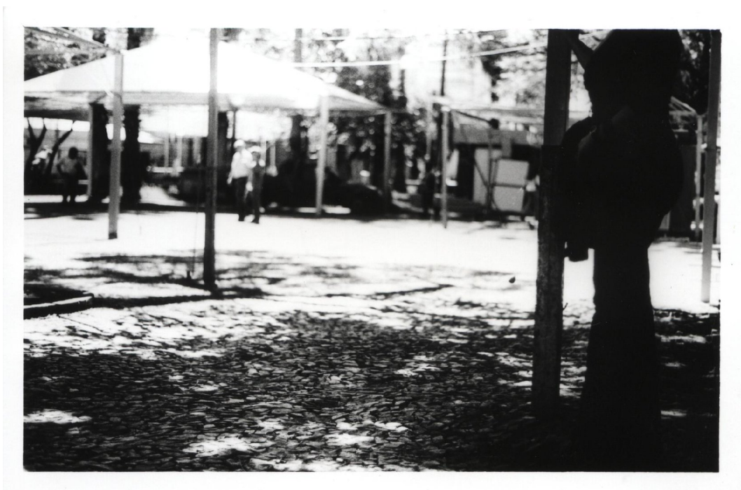
Figura 28: Espaço da prostituição. - Esta fotografia foi tirada em outubro de 2005 em meio à montagem da tradicional Feira do Livro de Porto Alegre. Nota-se em primeiro plano a figura da prostituta e em segundo plano os estandes da feira.