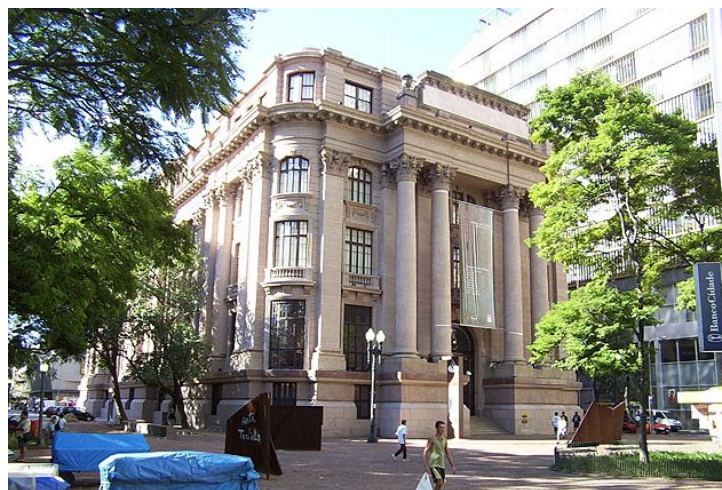
Figura 13: Santander Cultural.