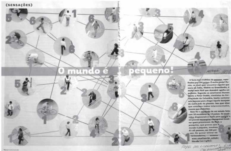
Figura 3 – Conexões Possíveis