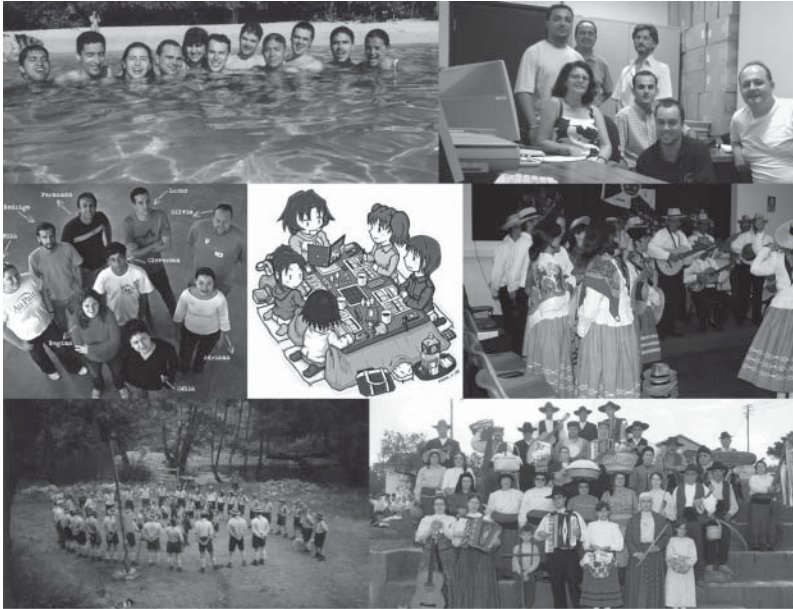
Figura 2 – Mosaico de Imagens sobre Grupo