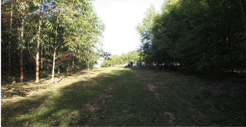
Figura 8 - Caminho no Campo

Demonstramos nas Figuras a seguir o trajeto que fizemos até a chegada ao local onde se encontra o Cemitério das Cortiças.