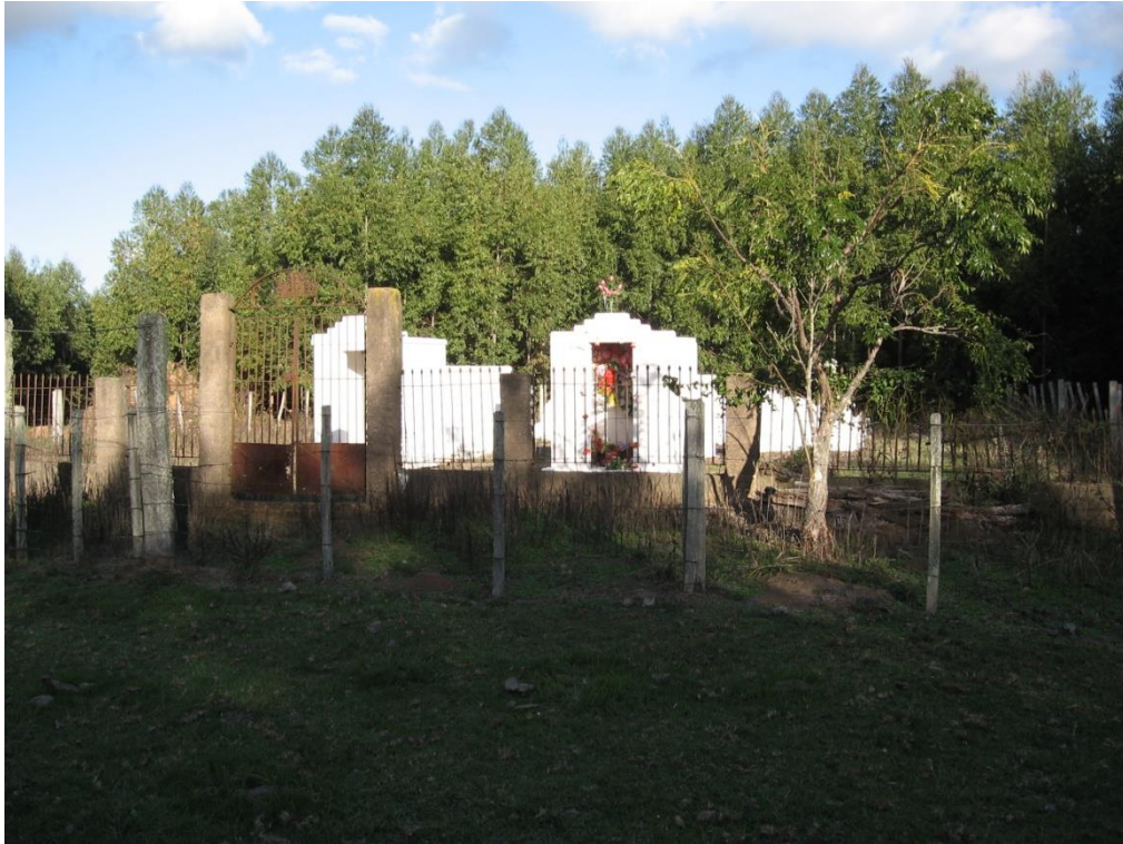
Figura 6 – Entrada do Cemitério