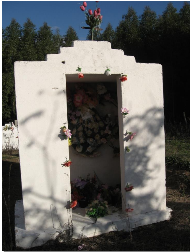
Figura 10 - Capela