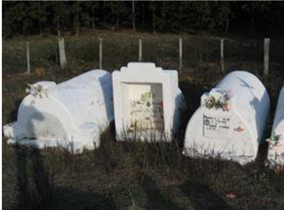
Figura 12 - Túmulos no Cemitério das Cortiças