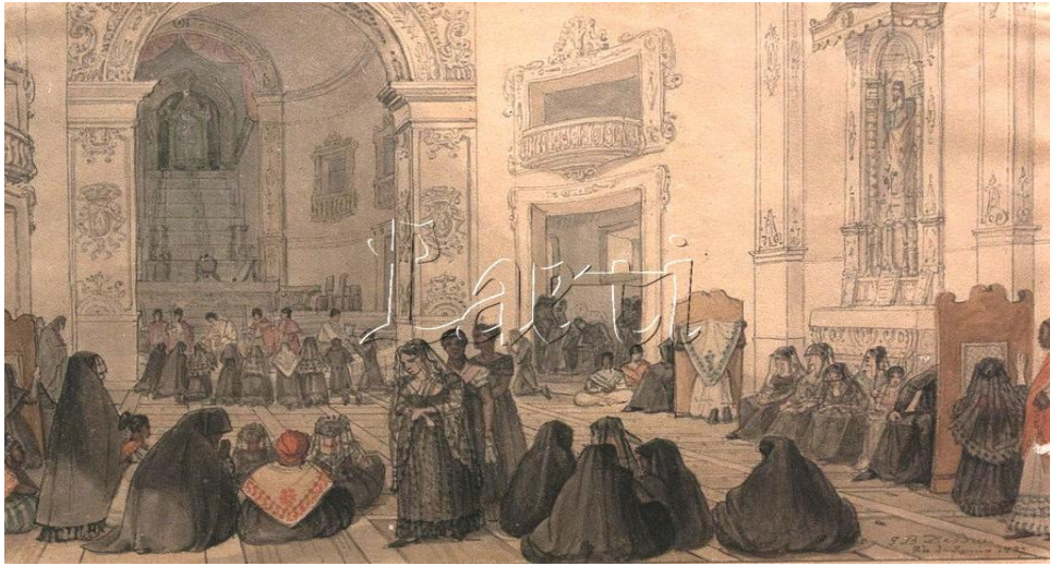
Figura 1 – Debret A Quaresma: Cena numa Igreja em 1827 numa manhã de quarta-feira Santa