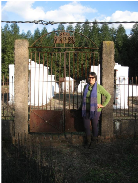
Figura 3 - Portal