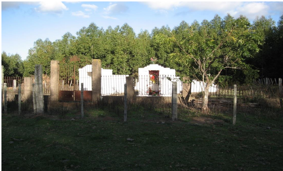
Figura 2- Cemitério das Cortiças

A citação acima mostra a utilização de cercamento conforme o que encontramos no Cemitério das Cortiças considerando sua prática, inclusive em outras regiões, como Bagé e São Borja, regiões de Campanha e próximas à Candiota onde hoje está localizado o referido cemitério. No registro obtido nas fotos do local (Figura 2; Figura 3) constata-se que ao longo dos anos foi colocado arame farpado como proteção apenas, mantendo-se as pedras que não sofreram desgaste com o passar do tempo, principalmente na parte frontal onde está o portal intacto e nas laterais provavelmente diminuindo também, o tamanho original.