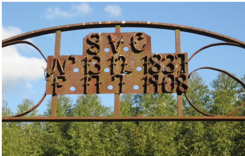
Figura 4 - Portal Cemitério das Cortiças

O Cemitério das Cortiças, construído no interior de uma fazenda leva no portal as iniciais SVC de Sátiro Valério da Cunha com as datas de N° 13 12 1837 e F 17 7 1908 (Figura 4). Confrontando então estas iniciais, SVC e as datas, encontradas no livro João Rodrigues da Silva e sua descendência, constata-se que efetivamente pertencem a Sátiro Valério da Cunha (RHEINGANTZ, FELIZARDO, 1952-1953).