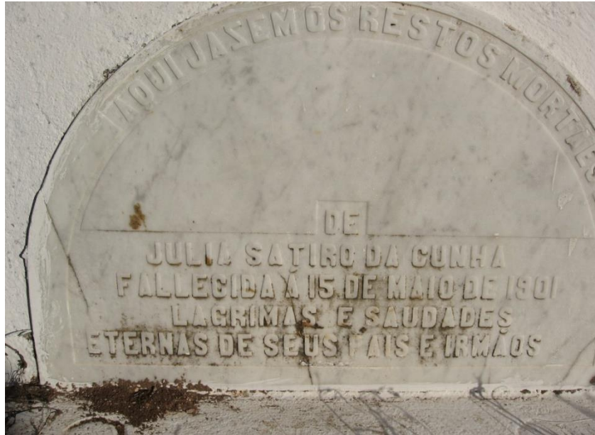
Figura 13 - Túmulo de Julia Satiro da Cunha

noiva já pronto e é o túmulo (Figura 13) mais antigo do Cemitério datado de 1901.