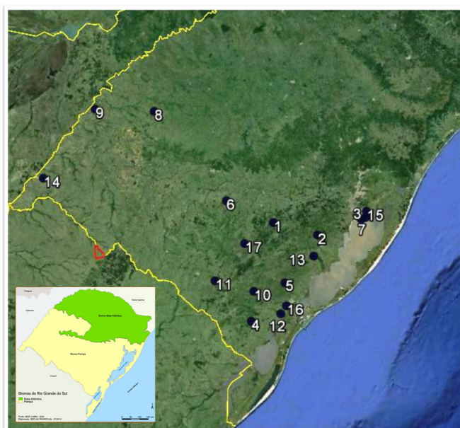
Figura 1: localização das unidades amostrais referentes aos levantamentos fitossociológicos do banco de dados.