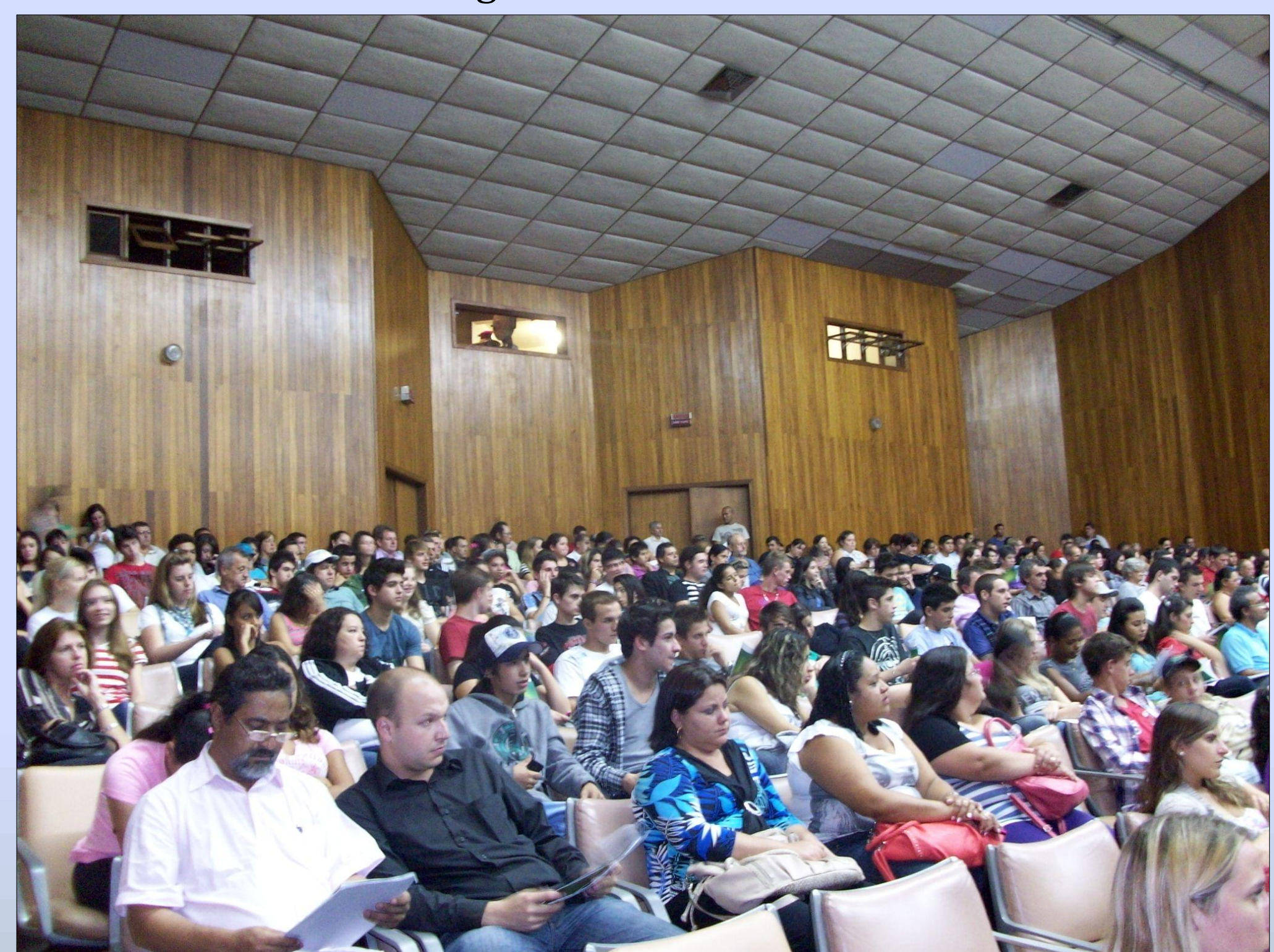
Audiência Pública Regional do Vale do Rio dos Sinos 2012

É possível identificar preliminarmente que a participação na escolha de demandas para a região ou município podem proporcionar aprendizagens que levam à democratização das relações de poder, sendo que todas as etapas do processo de decisões orçamentárias e da implementação das decisões são expressões do exercício de poder. Destaca-se o papel dos organizadores e coordenadores das regiões e municípios nos jogos de poder entre as diversas instâncias.