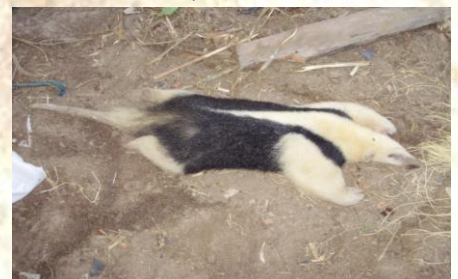
Figura 3: Mamífero encontrado em borda de mata. Fonte Valdemar da Silva, 2012.