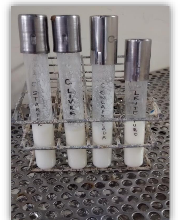
Figura 4. Amostras de leite apresentando-se coaguladas após 72 horas de inóculo de cultura livre e encapsulada.