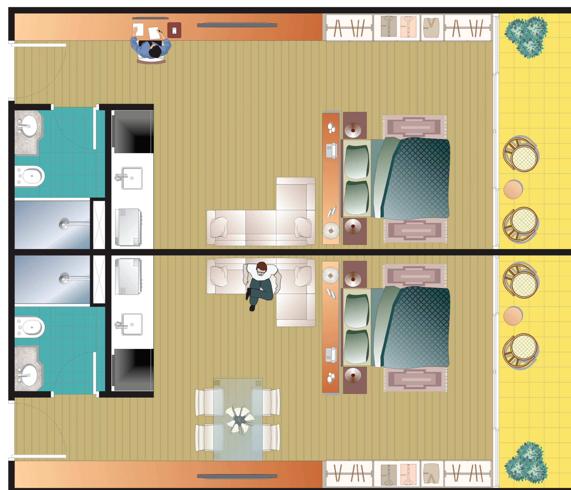
Planta Baixa Mobiliada Apartamento Tipo