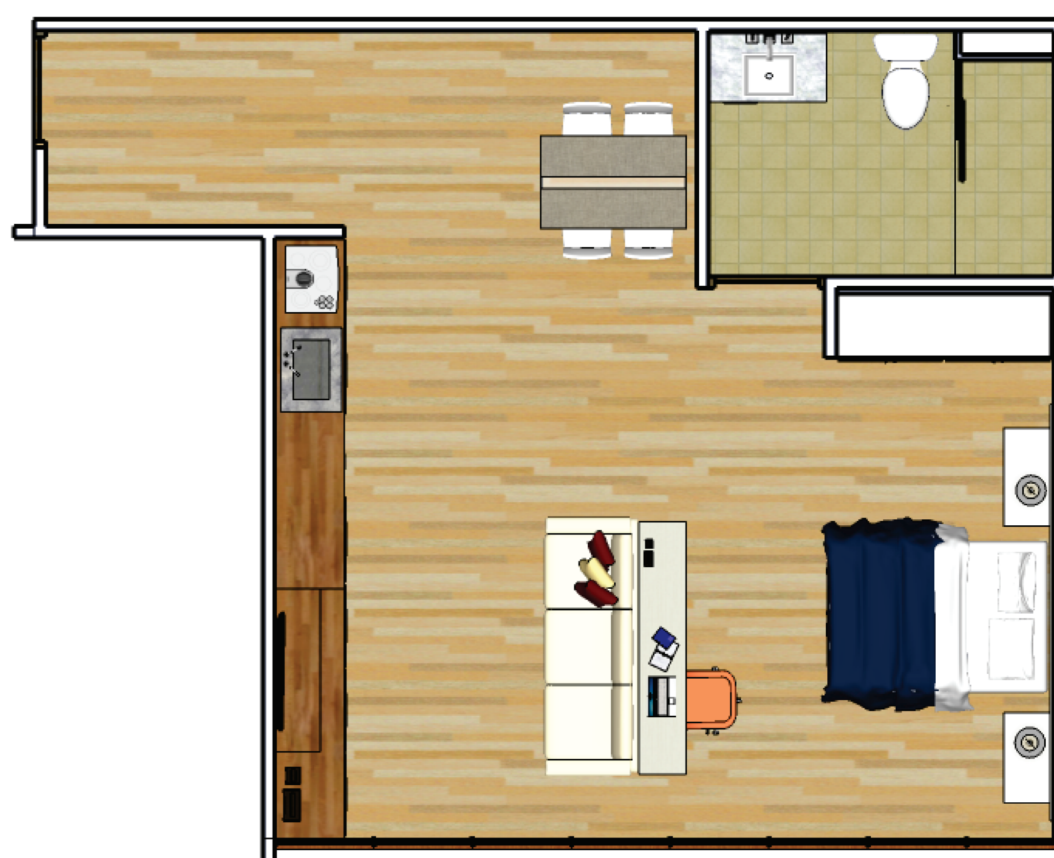
Planta Baixa Mobiliada Apartamento Acessível