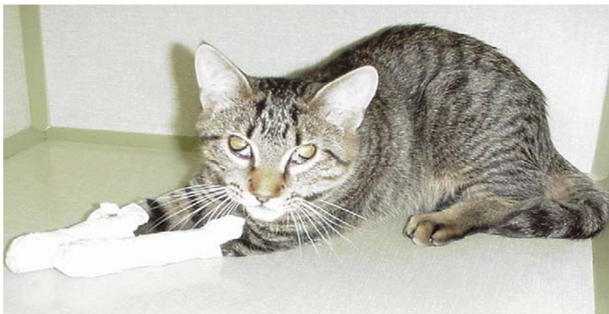
Figura 4- Gato utilizando ataduras após a retirada das unhas. A diferenciação entre dor e antipatia por atadura é difícil, porém o gato da figura apresenta sinais de dor como imobilidade, encurvamento da postura e não resposta a estímulos.

utilização destas, é necessário que o observador consiga diferenciar entre estar com dor ou não gostar de curativos restritivos (Figura 4).