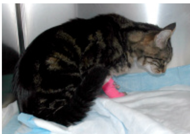
Figura 3- Gato com dor aguda mantendo a cabeça para baixo, imóvel e não responsivo à presença humana.

LASCELLES e WATERMAN, 1997). Segundo Lascelles (1997), o melhor meio de avaliar o grau da dor sentida por um gato é a observação do seu comportamento. Felinos com dor traumática ou pós-operatória aguda normalmente apresentam sinais de depressão, ficando imóveis e silenciosos, podendo parecer tensos e distanciados do ambiente em que se encontram não respondendo ao carinho ou atenção humana, e muitas vezes tentam se esconder (Figura 3).