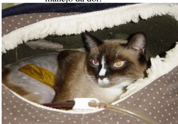
Figura 6-Gato em ambiente seco e confortável, com melhora no manejo da dor.

Como o grau de dor pode sofrer impacto do ambiente no qual o gato se encontra, é importante lembrar que cuidados gerais são fundamentais. Um animal que se encontra em condições confortáveis sofre menos com sua condição dolorosa do que um animal que se encontra molhado, com frio, fome, sede, assustado ou em local que impossibilite que sua bexiga seja esvaziada. A imobilização de uma parte do corpo, apesar de contribuir para analgesia, deve ser usada de maneira criteriosa, pois alguns gatos não toleram bandagens. Também se deve lembrar que nem todo gato tem histórico de contato com cães e isso pode ser um fator estressante para gatos que não toleram a presença desta espécie. Por isso é ideal que hospitais veterinários tenham áreas separadas para gatos ou alojamento cobertos e com caixas que permitam que se escondam e se sintam mais seguros (TAYLOR, 2004).