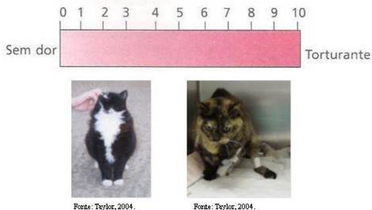
Figura 5- Escala analógica visual. Esta escala norteia e auxilia no diagnóstico da dor. O escore 0 corresponde a um animal alegre e responsivo ao contato humano. Um animal com escore 5 precisa de suplementação analgésica e tem sinais de desconforto e prostração, sendo a que o escore 10 corresponde a uma dor torturante.

Lascelles et al. (1994) propõe uma escala descritiva (Tabela 1) que utiliza a palpação e a observação do comportamento como diagnóstico.