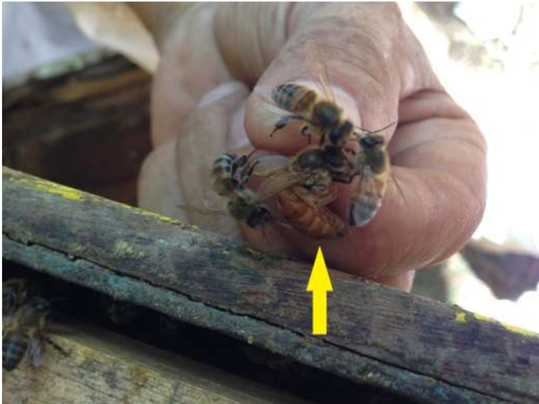
Figura 5. Rainha de Apis mellifera (flecha amarela) com operárias ao redor.

Uma das experiências mais emocionantes neste estágio foi a retirada de um ninho dentro de uma parede dupla de madeira de uma residência em Porto Alegre. Após a chegada ao destino e observada a entrada das abelhas, foi colocada fumaça e retirada as tábuas de madeira, cada tábua retirada era uma surpresa, pois não se sabia o tamanho do ninho. Ao total foram retiradas cinco tábuas e então observado o tamanho real do ninho, que possuía apenas um favo único de cerca de um metro. Foi cortado o favo em três partes, e encaixado dentro dos caixilhos, e então foi necessária a captura da rainha. Com a observação da movimentação das abelhas foi observada a sua localização e então ela foi colocada dentro de uma caixa de fósforos, que posteriormente foi introduzida no núcleo com os demais caixilhos.