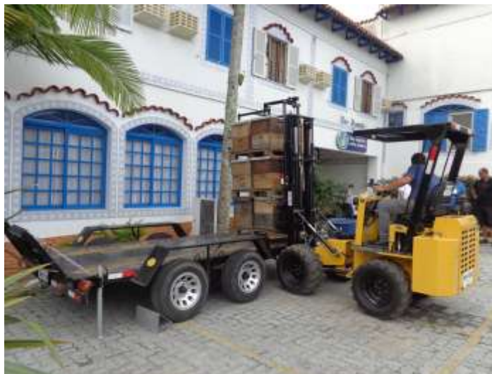
Figura 9. Empilhadora apícola

relatado que o carregamento de oitocentas colmeias entre duas pessoas é efetuado em cerca de uma hora, enquanto que aqui no Brasil onde a grande maioria dos apicultores não possui este maquinário, leva-se em torno de meio dia com quatro pessoas trabalhando. Foi visto que havia grande diferença também, em relação à criação de rainhas destes americanos comparada com as da região, onde são produzidas diariamente cerca de quinhentas realeiras enquanto que no Texas eram produzidas cerca de duas mil.