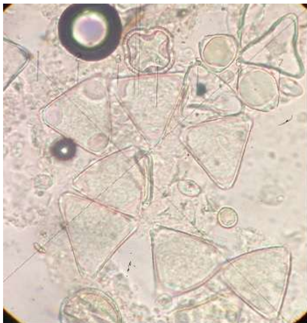
Figura 8. Perfil polínico de eucalipto

Outro teste é o de Lund, que deve dar positivo na reação. Esse teste serve para detectar o nível de proteína mínimo do mel, e comprovar que este possui pólen, como já é feita a análise botânica a partir do pólen encontrado no mel sua resposta é que já o possui, sendo então positivo.