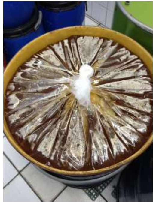
Figura 2. Transferência de mel com motobomba. Figura 3. Mel ensacado em tambor.