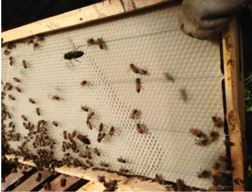
Figura 1. Caixilho com Apis mellifera sobre lâmina alveolada.

A apicultura foi introduzida no Brasil, mais precisamente no estado do Rio de Janeiro em 1839, quando o padre Antônio Carneiro trouxe da Europa algumas colônias de abelhas europeias ( Apis mellifera spp.). Posteriormente foram trazidas, por imigrantes europeus, diferentes raças desta mesma espécie, para a região Sul e Sudeste, hoje as maiores produtoras de mel no Brasil (IBGE, 2013).