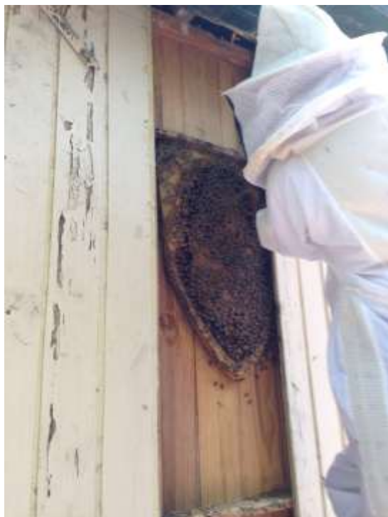
Figura 6. Ninho de Apis mellifera em residência urbana.