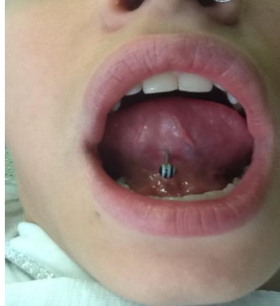
Figura 6- Exemplo de alteração observada com a utilização do piercing - nóculo lingual