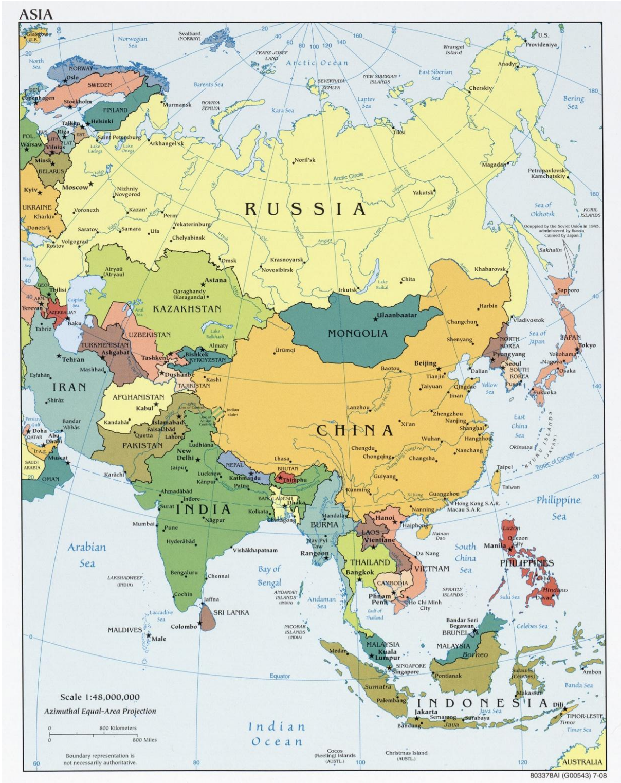
Mapa 1 — Ásia (Político)