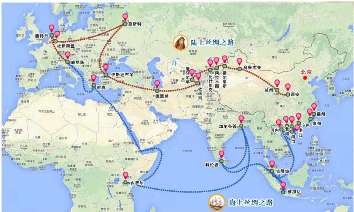
Mapa 4 — O projeto para a Nova Rota da Seda