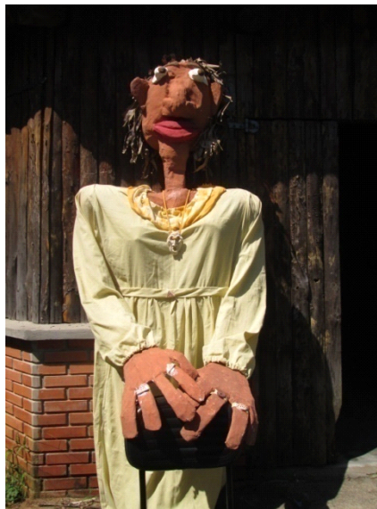
Fig: 25 - Exibindo anéis e brincos