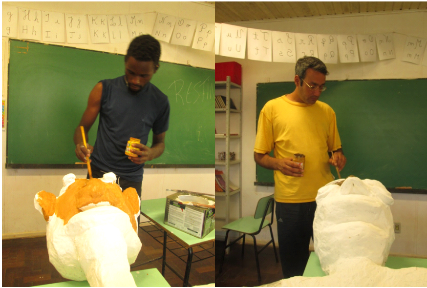
Fig: 20 - Pintando a cabeça mulher Fig: 21- Pintando a cabeça homem