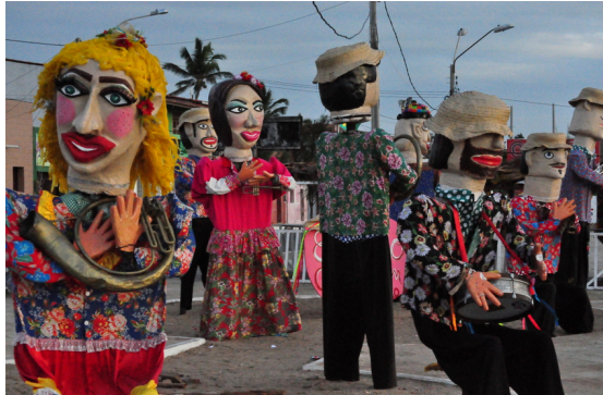
Fig: 1- Grupos Gigantes Circo de Pedras