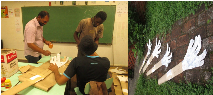
Fig: 22 - Confeção braços e mãos Fig: 23 - Mãos de arame, papel e papelão