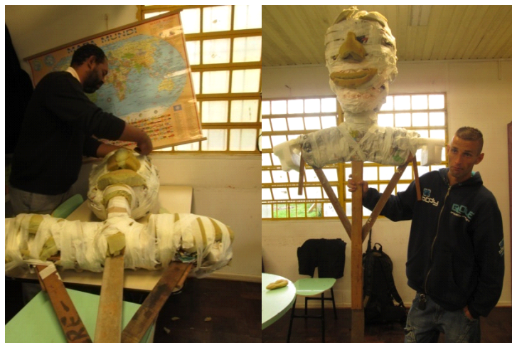
Fig: 13 - Construindo a forma da cabeça