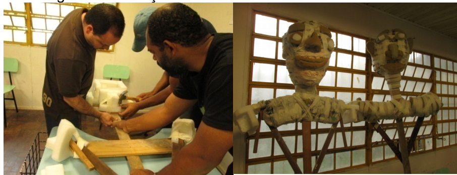
Fig: 11- Início do volume na madeira