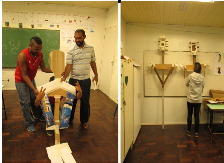
Fig: 9 - Elaboração da estrutura em papelão