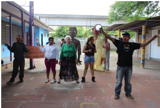
Fig: 28 - Proporção e altura