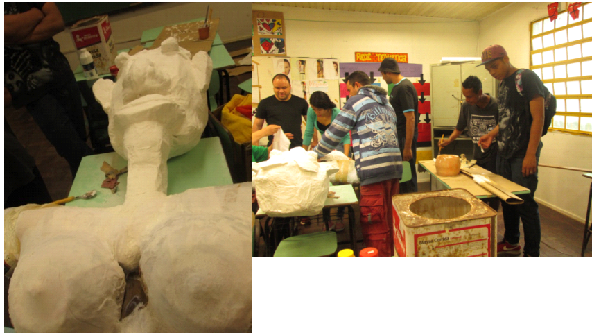
Fig: 15 - Seios