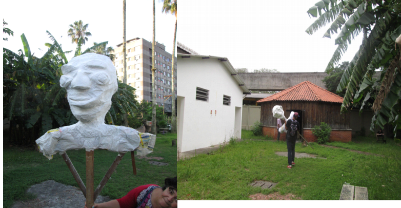
Fig: 16 - Colocação da massa gessada