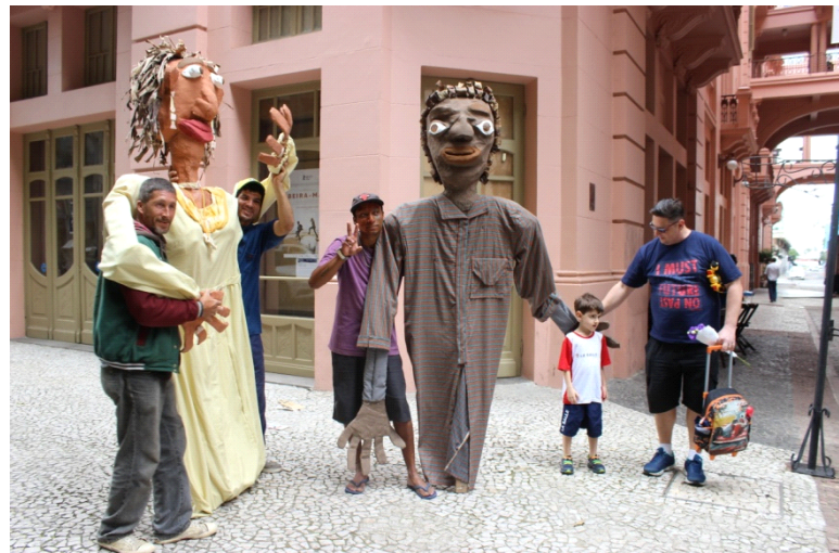
Fig: 32 - Casa de Cultura Mario Quintana