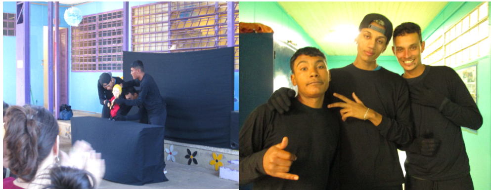
Fig: 5 - Apresentação da esquete musical