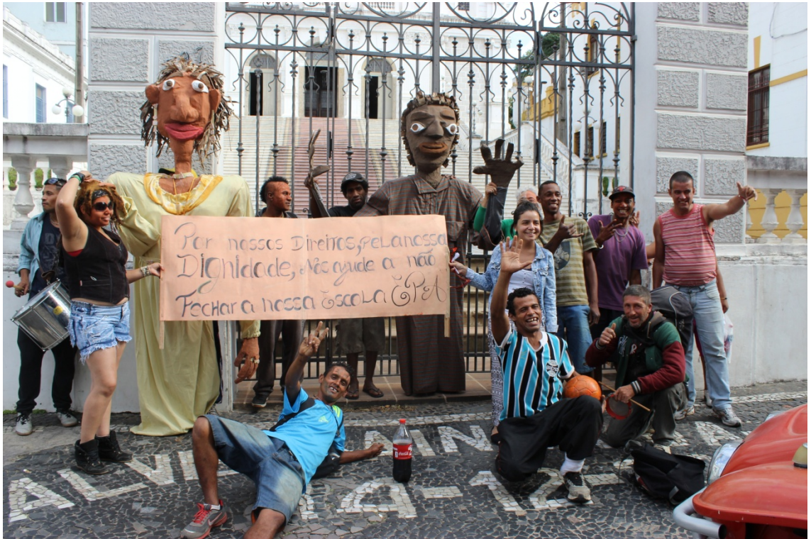
Fig: 39 "Por nossos direitos, pela nossa dignidade, nos ajude a não fechar a nossa escola".