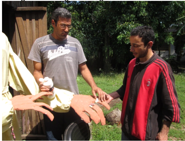
Fig: 26 – Alunos fazendo adereços com cerâmica (brincos, colares, anéis e cinto)