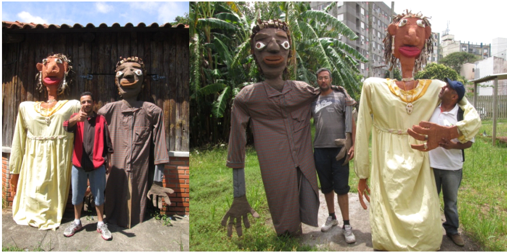
Fig: 27 - Proporções de altura