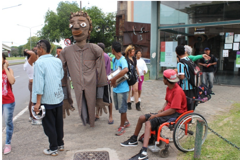
Fig: 31 - Caminhada no Gasômetro