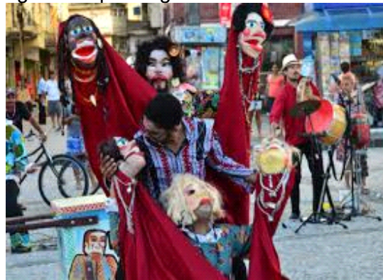
Fig: 2 - Grupo Galpão