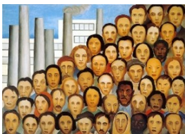
Os Operários, 1933

- Fazer a leitura de imagem da Tarsila do Amaral;