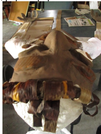
Fig: 24 – Fazendo cabelos – folhas de bananeira