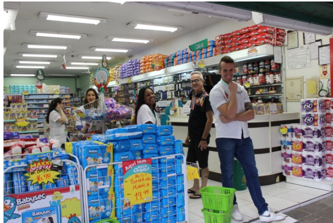
Fig: 35 – Público prestigiando