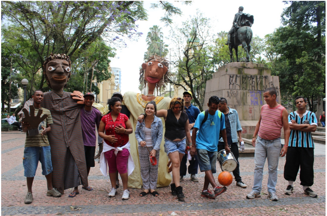
Fig: 37 – Pose final na performance