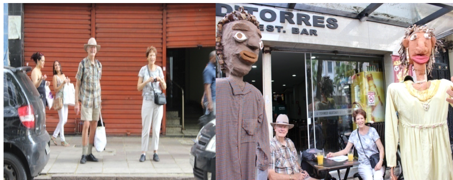
Fig: 33 e 34 -Turistas do Estados Unidos