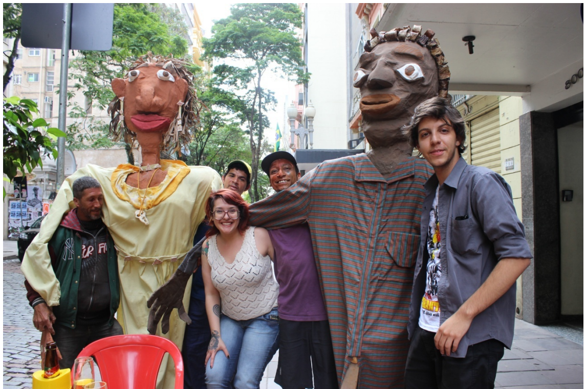
Fig: 36 – Admiradores da EPA