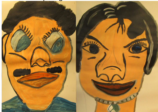
Fig: 18 - Desenho e pintura A2 Homem