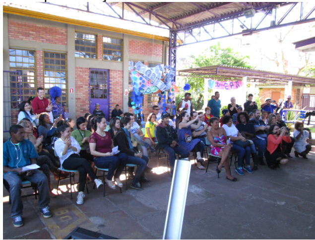
Fig: 7 - Formação de público para os bonecos. Aniversário da escola com a presença da comunidade, professores, SMED, escritores, artistas e TVE.