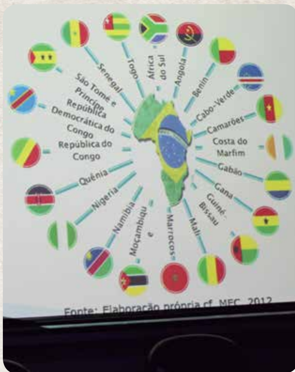
Primeiros estudantes brasileiros ao Brasil

liaridade do meu curso e do momento em que cheguei, mas a Universidade não conseguiu efetivamente, criar estruturas adicionais de apoio aos estudantes que chegam. Num primeiro momento, quando cheguei, me senti bastante deslocado e imagino que todos os estudantes africanos que chegam, chegam numa situação em que estão um tanto e quanto jogados para procurar a forma de se inserir e de criar a sensação de estar em casa e poder estudar. A UFRGS tem falhado ao longo de todo esse processo em proporcionar uma estrutura de apoio ao estudante, particularmente ao que vem da África; eu acho que o contraste, de fato, é grande quando se olha, por exemplo, estudantes que vêm da China, toda uma estrutura de acolhimento, de apoio ou os que vêm da Europa. Os estudantes africanos são largados à sorte: quando cheguei, por exemplo, cheguei com uma mala, estava no meio da rua, sem saber exatamente para onde ia, num domingo, e alguém me apontou a casa dos estudantes. Fui para lá onde, por acaso, não tinha lugar; fiquei um ano no quarto de hóspedes. Imagino que a situação não tenha mudado muito de lá para cá, mas tudo isso exatamente gera alguns percursos nos quais os estudantes conseguem superar as dificuldades, se inserir, e acabam voltando para casa com o que estava