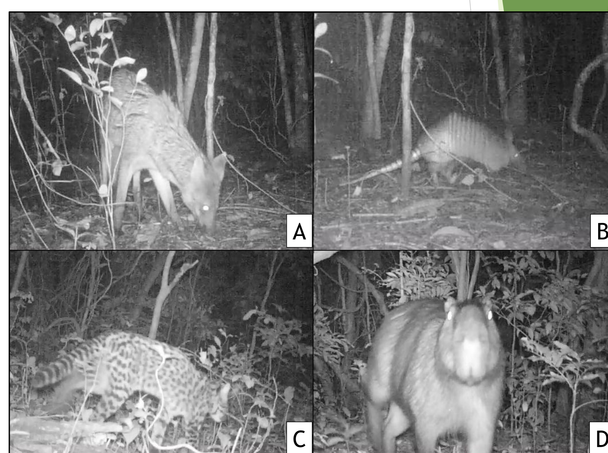
Figura 2. Espécies registradas na área de amostragem na Estação Ambiental BRASKEM no período de Dezembro de 2014 - Janeiro de 2015. A) Cerdocyon thous ; B) Dasyurus novemcinctus ; C) Leopardus guttulus ; D) Hydrochoerus hydrochaeris .

Na primeira campanha realizada, o esforço de captura obtido foi de 295 armadilhas/noite, sendo identificadas sete espécies de mamíferos: Didelphis albiventris , Dasyurus novemcinctus , Hydrochoerus hydrochaeris , Coendou spinosus , Cerdocyon thous , Procyon cancrivorus e Leopardus guttulus (Figura 2). Quanto ao número de registros obtidos, a primeira campanha resultou em um total de 161 registros sendo Cerdocyon thous e Dasyurus novemcinctus as espécies mais frequentemente registradas com mais de 50 registros independentes cada, sendo seguidas de Hydrochoerus hydrochaeris e Leopardus guttulus , com 12 e 11 registros, respectivamente (Tabela 1). Considerando a análise dos registros nas quatro categorias diárias, apenas a espécie Hydrochoerus hydrochaeris foi registrada no período diurno, sendo todas as outras espécies registradas unicamente nos períodos crepusculares e noturno (Figura 3). Conforme novas campanhas forem realizadas os dados serão analisados comparativamente a fim de identificar variações nos padrões observados na primeira campanha.