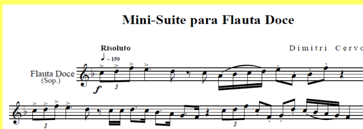
Peça editada em programa de partitura

Já o acervo em papel possibilita o trabalho direto com as obras, seja para análise musical ou execução em concerto, sem o manuseio das obras originais (manuscritas, impressas ou editadas comercialmente).