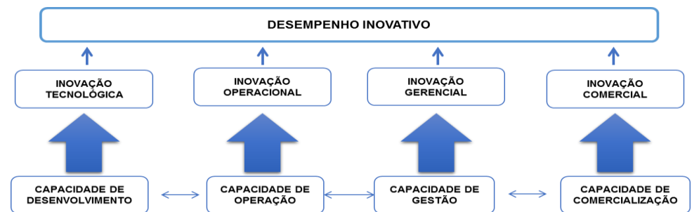
Figura 3: Modelo de Capacidades de Inovação