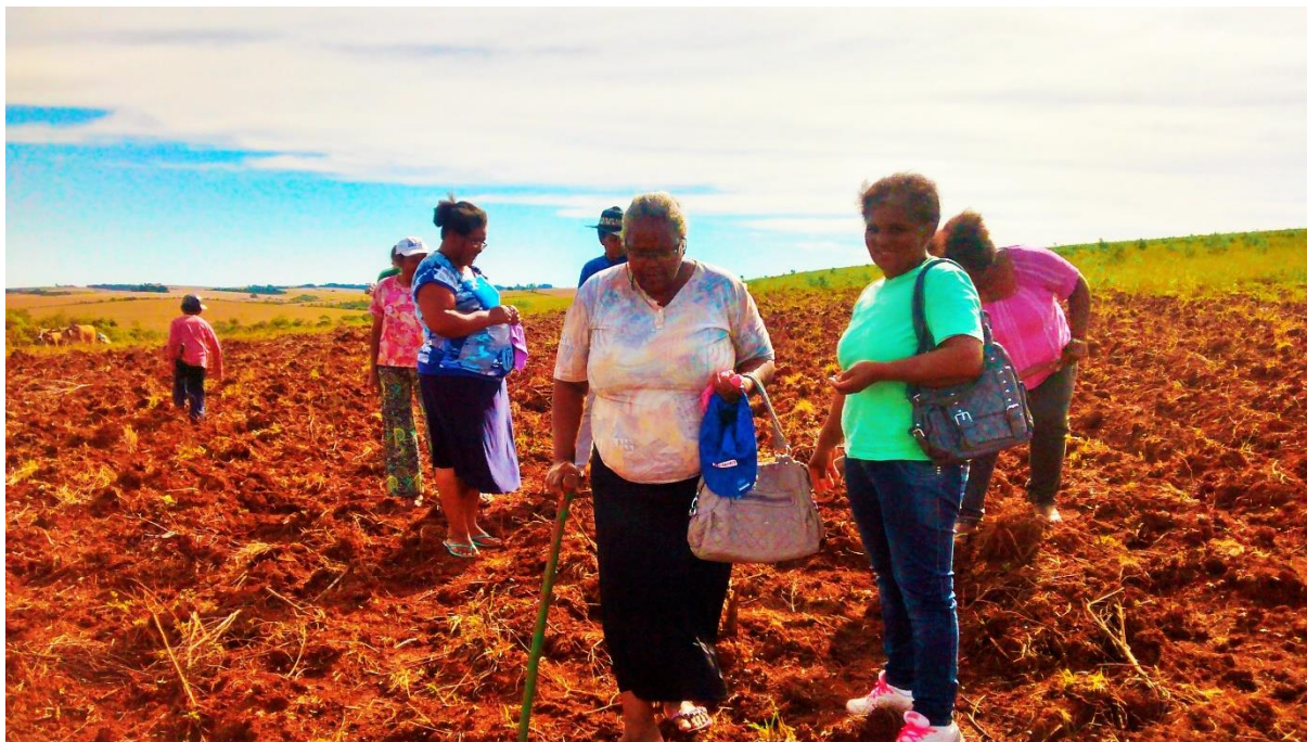
Imagem 5: Mulheres na roça 74 .