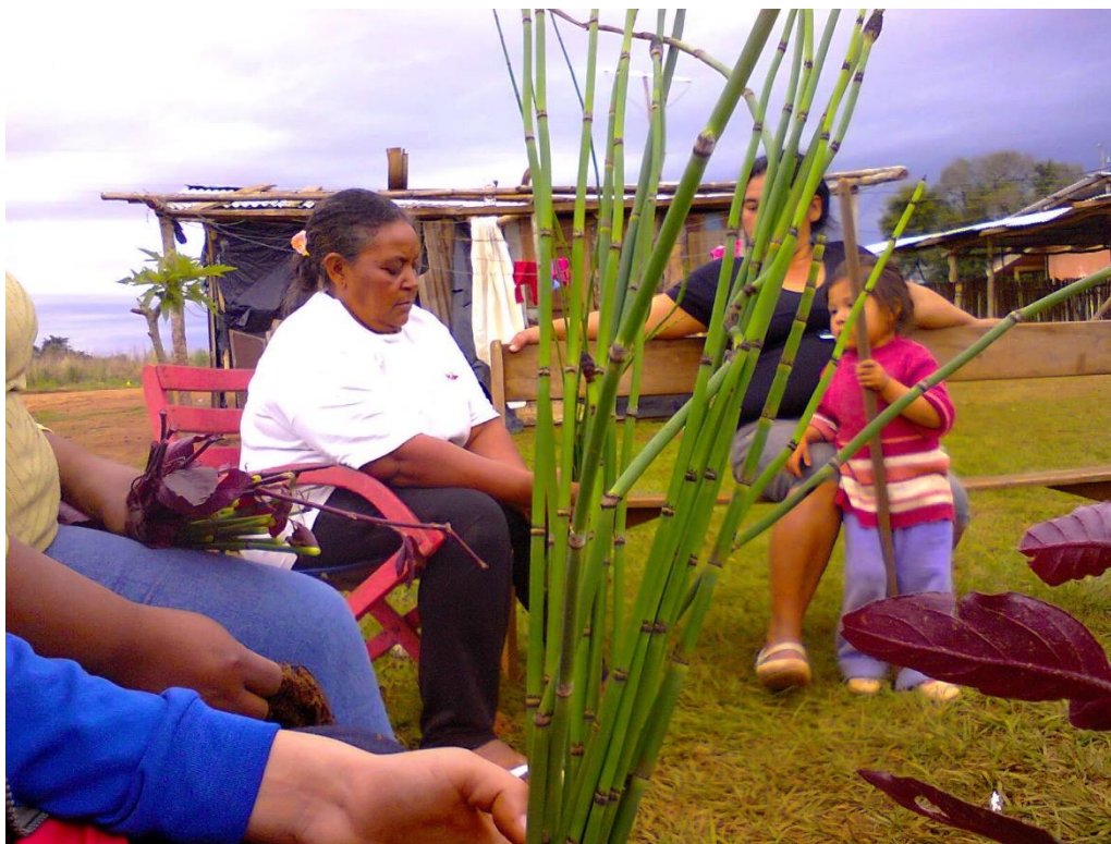
Imagem 6: Visita ao acampamento Kaingang do coletivo da Guarita.