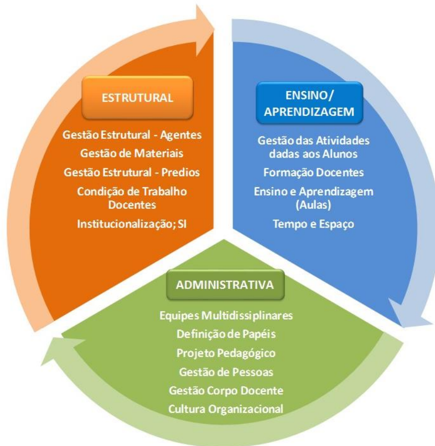
Figura 1 – Gestão da EAD