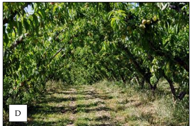
Figura 75. Cultivo de ervilhaca solteira em vinhedo (A); de azevém solteiro em pomar de pessegueiro (B) e de ervilhaca consorciada com aveia em vinhedo (C) e em pomar de pessegueiro (D).

A semeadura em linha utilizando semeadoras apropriadas ou a semeadura a lanço e posterior incorporação com grade de discos pode ser uma alternativa adotada. Porém, existe o risco desses equipamentos cortarem as raízes das frutíferas do pomar, potencializando a incidência de doenças. Outra prática mais recomendada para a implantação das plantas de cobertura no outono-inverno é a realização da semeadura a lanço e posterior roçada das espécies de plantas de cobertura existentes na área, de modo que os resíduos culturais destas faça o recobrimento das sementes. Para isso, é importante que as plantas espontâneas, crescidas no período de verão, permaneçam a uma altura adequada, sem prejuízos para o fruticultor realizar os tratos culturais do pomar, mas que possibilite uma produção de resíduos capaz de atender o objetivo proposto. Nesta forma de semeadura (sementes a lanço e roçada da vegetação espontânea), se recomenda adicionar 50% a mais de sementes do que a dose utilizada para cultivos em áreas de lavouras anuais, em que a semeadura é realizada com incorporação. Esse aumento da dose de sementes se deve ao fato que parte delas podem ficar sobre os resíduos culturais, diminuindo o contato semente-solo.