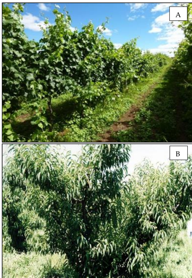
Figura 74. Videiras (A) e pessegueiros (B) com excessivo vigor da parte aérea provocado pela aplicação de doses elevadas de fertilizante nitrogenado.

Mesmo assim, tanto em sistemas de recomendação para frutíferas temperadas, por exemplo, no RS e SC, bem como em outros tradicionais países produtores de frutas do mundo, o uso da produtividade esperada tem sido usado alicerçado no fato de que, se estimando a produtividade, aliada ao teor médio de nutriente no fruto, pode-se definir, mesmo que de maneira muito aproximada, a quantidade de nutriente exportada via fruto. Com isso, tem-se uma aproximação da quantidade de nutriente que deve ser adicionada no solo via adubação, princípio este considerado na elaboração da maioria das tabelas de recomendação de fertilizantes para a adubação de manutenção na maioria das frutíferas temperadas.