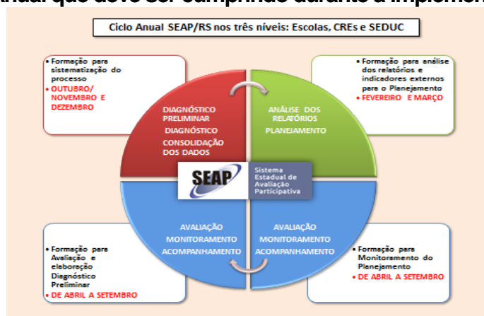
Figura 1 – Ciclo Anual que deve ser cumprido durante a implementação do SEAP/RS