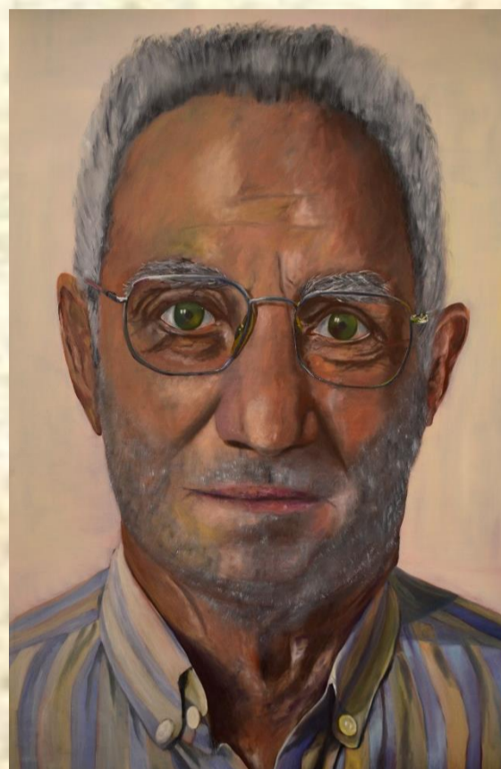
Fig. 1 - Sem título, 2016 Óleo sobre tela, 165 x 110 cm

Este estudo sobre o retrato foi iniciado em 2015 a partir de meu interesse em expressar uma imagem do retratado que tornasse evidente aspectos culturais e emocionais. Esta pesquisa inclui a produção de uma série de pinturas de retratos em óleo sobre tela. Optei por aumentar a escala das pinturas para uma escala maior do que o natural, as telas têm 165x110cm, com a intenção de provocar uma maior intimidade entre o espectador e os detalhes da pintura. O formato 3x4 tornou-se referência para meu trabalho por que é o tipo de fotografia que todos têm, que todos utilizam em seus documentos. A escolha do formato justifica-se por seu caráter convencional, por sua relação com o documento, a identidade de alguém.