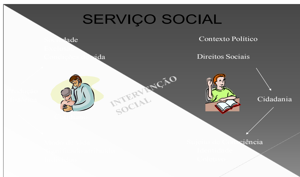
Figura 2 - Intervenção social na busca de cidadania.

Com esta compreensão, desenvolvemos ações que buscam o fortalecimento dos sujeitos, com orientações sobre recursos Institucionais (HCPA) e encaminhamentos para as redes sociais que possam auxiliar nas necessidades identificadas (falta de recursos de diferentes ordens) como impeditivas de aproveitamento máximo do tratamento proposto.