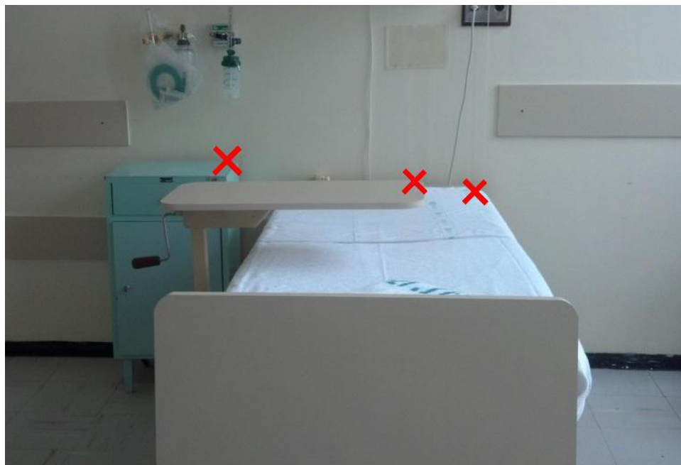
Figura 2: Exemplo de leito avaliado após a limpeza terminal, com indicação das superfícies testadas pela metodologia de detecção de adenosina trifosfato.