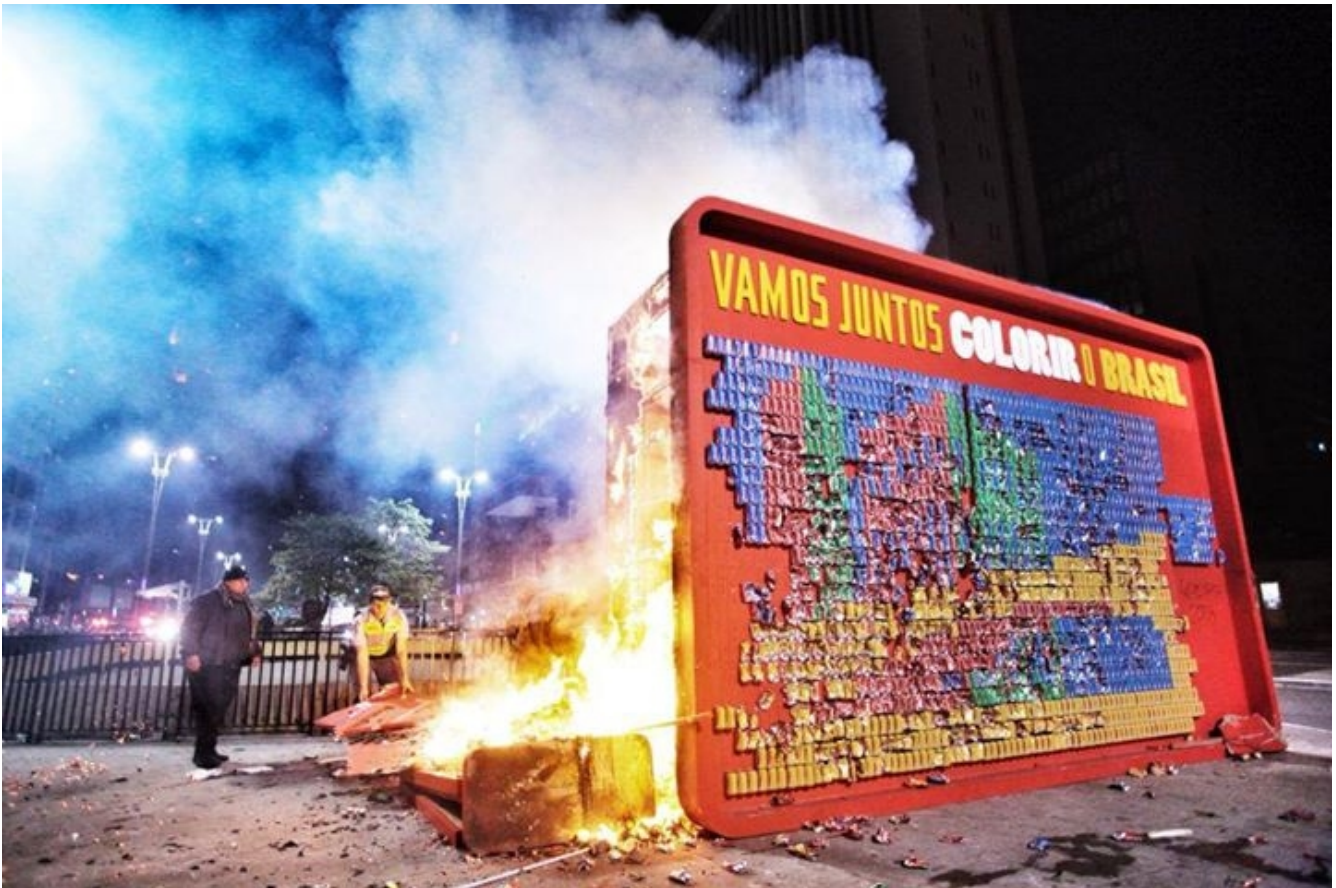
Figura 3: Painel da Coca-Cola queimado.

A rede mobilizada para a ação de transmissão ao vivo do acontecimento daquele momento, o confronto entre policiais e manifestantes na rua Augusta e na Avenida Paulista, era composta de diversos atores, entre os quais: