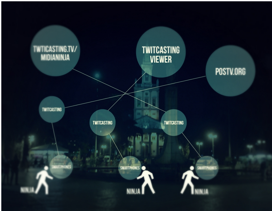
Figura 7: Mapeamento ator-rede de 23 de julho de 2013. Montagem sobre foto do Largo do Machado.