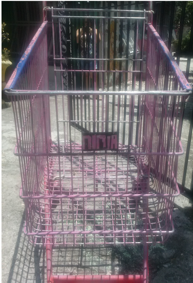
Figura 10: Carrinho Ninja usado na Xepa.