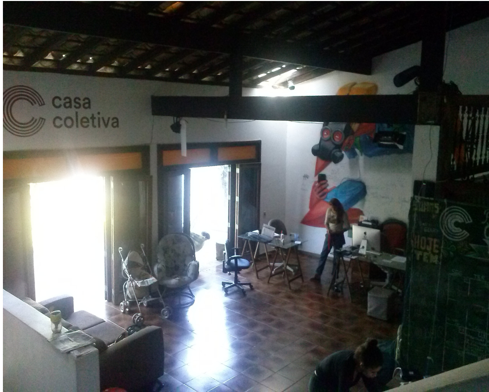
Figura 8: Vista da sala principal da Casa Coletiva; à direita, mezanino e entrada da cozinha.

dos integrantes na sala principal; horário do almoço e identificação de prateleiras com pratos, copos, xícaras e talheres na cozinha; etiquetas com nomes de equipamentos de vídeo e áudio na ampla sala de edição, localizado no andar abaixo da sala principal; instruções para lavagem ecológica em baldes na área de serviço, localização de toalhas e roupas de cama no armário do espaço reservado aos moradores, onde se localizam os quartos da casa.