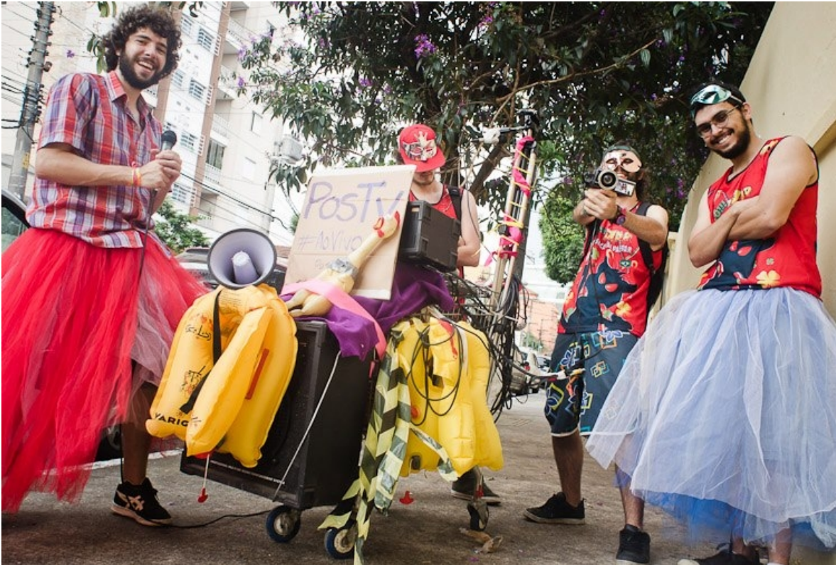
Figura 2: "Nas ruas e nas redes! A PósTV faz o link direto entre os espaços físicos e virtuais, com o carrinho alegórico não precisamos de muito para criar uma viatura de intervenção ao vivo". Fonte: Filipe Peçanha 168 .

Embora tenha funcionado bem para o que se propunha, o carrinho foi sendo repensado como estrutura de transmissão ao vivo. A partir do carnaval, passaram a pesquisar de forma mais efetiva aplicativos que possibilitassem o streaming direto de um smartphone . O TwitCasting foi o mais usado a partir de então, principalmente pela característica descrita anteriormente: transmitir áudio e vídeo mesmo com redes de internet instáveis e com pouca velocidade, como era o caso de coberturas que a PósTV - e a nascente Mídia Ninja - queriam realizar nas ruas das cidades. Os integrantes do grupo não fizeram testes detalhados para saber como funcionava o algoritmo de cada aplicativo, mas, com prática na atividade de transmissão, souberam o que queriam ao usar o app no iPhone 4 169 , o dispositivo que utilizavam para fazer a transmissão ao vivo.