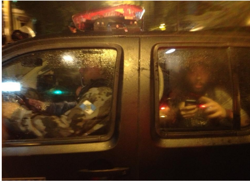
Figura 7: Filipe Peçanha (Carioca) é detido pela Polícia Militar do Rio de Janeiro.