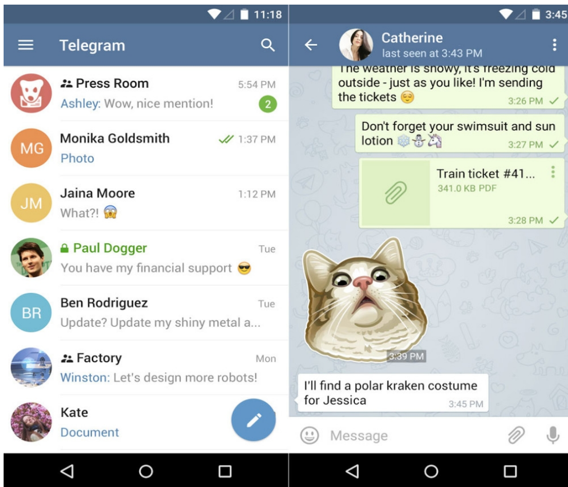
Figura 11: Interface do Telegram . Fonte: Site Frandroid 246

Por conta da visibilidade de sua agência, são necessários alguns parágrafos para descrever seu funcionamento.