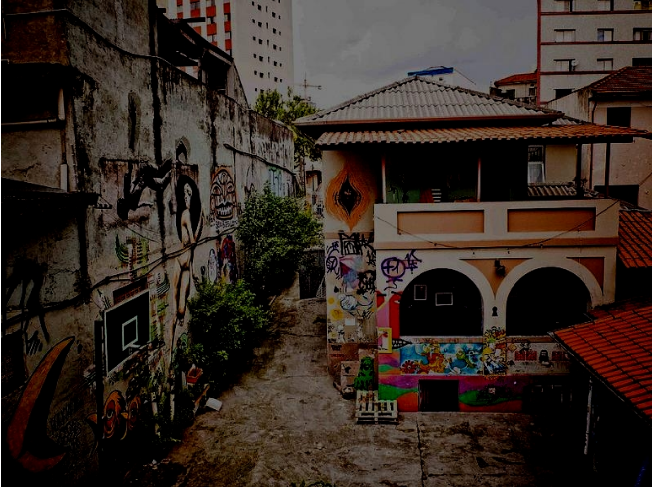
Figura 1: Casa Fora do Eixo São Paulo em outubro de 2013, vista do prédio anexo aos fundos.

Patrícia 104 conta, em conversa realizada na residência Outros Carnavales em fevereiro de 2016, como surgiu a casa: