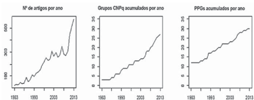
Figura 3 – Dinâmica de crescimento das publicações anuais, grupos do CNPq e PPGs da FAE brasileira (1983-2013)

Na Figura 3, observa-se um crescimento contínuo tanto do número de publicações anuais quanto do número de grupos do CNPq e de PPGs na série temporal analisada. De fato, o aumento da produtividade da área pode ter sido consequência da expansão da pesquisa a partir da criação de novos PPGs e comunidades científicas. Da mesma forma, a ampliação do número de bolsas e incentivos, a maior cobertura das bases de dados internacionais e o incremento dos trabalhos em coautoria contribuíram para o desenvolvimento da disciplina no âmbito nacional.