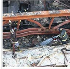
Bombeiros apagam novo incêndio no teatro

PAULO - O Corpo de Bombeiros foi acionado na tarde desta terça-feira, 19, para combater um pequeno foco de incêndio no Teatro Cultura Artística, no centro da capital paulista. Três equipes da corporação foram para o local e o fogo foi extinto. Na madrugada de domingo, um incêndio destruiu o teatro, um dos mais tradicionais da cidade. Ele foi inaugurado em março de 1950 com um concerto de Heitor Villa-Lobos.