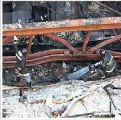
Bombeiros apagam novo incêndio no teatro

SÃO PAULO - O Corpo de Bombeiros foi acionado na tarde desta terça-feira, 19, para combater um pequeno foco de incêndio no Teatro Cultura Artística, no centro da capital paulista. Três equipes da corporação foram para o local e o fogo foi extinto. Na madrugada de domingo, um incêndio destruiu o teatro, um dos mais tradicionais da cidade. Ele foi inaugurado em março de 1950 com um concerto de Heitor Villa-Lobos.