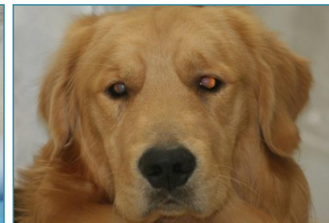
Figura 2: Cão da raça Golden Retriever com catarata.