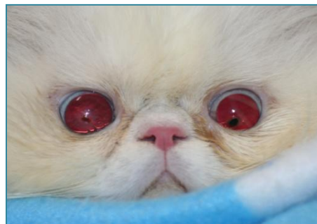
Figura 1: Gato com sequestro de córnea.

Fazem parte da equipe do Serviço de Oftalmologia Veterinária alunos de graduação e pós-graduação da UFRGS. Diariamente são realizados atendimentos clínicos e cirurgias em animais de companhia (Figuras 1, 2 e 3) e silvestres (Figura 4). Paralelamente também são desenvolvidas atividades em canis, gatis, mantenedores de fauna silvestre e avaliações oftálmicas dos cães de trabalho dos canis dos Órgãos de Segurança Pública de Porto Alegre. Também são realizadas campanhas de esclarecimento e de prevenção de doenças oculares junto à comunidade através de palestras, apresentações de trabalhos em congressos, publicações em revistas científicas e participações em eventos acadêmicos.