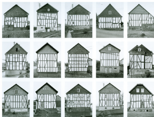
Figura 2 - “Fachwerkhäuser”, Siegener Industriegebiet, Alemanha 1959-1973