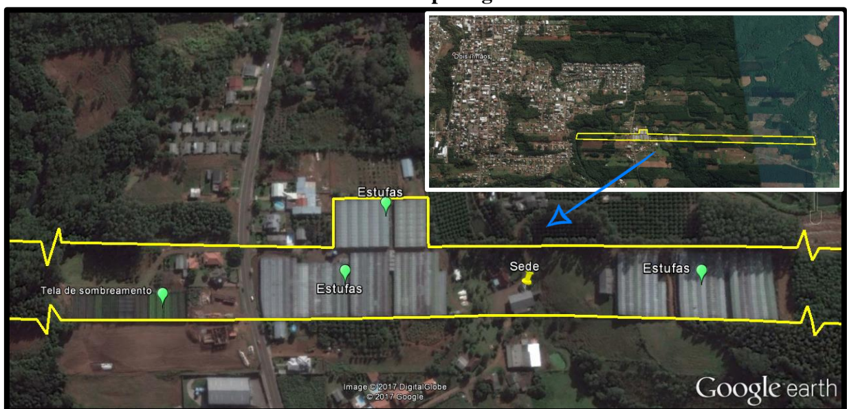
Figura 1. Vista aérea parcial da propriedade com indicação da sede e estruturas de ambiente protegido.

A propriedade localiza-se no município de Dois Irmãos, e está situada a menos de 2 km do centro da cidade. Conta com uma área total de 16,7 ha, sendo totalmente utilizável. Desta área, 3,6 ha possuem cobertura plástica, ou seja, estufas, 0,9 ha cobertos com tela de sombreamento, 3 ha de campo e benfeitorias, e os 9,2 ha restantes, destinados ao reflorestamento com acácia negra ( Acacia decurrens ) e eucalipto ( Eucalyptus sp. ), conforme ilustra a Figura 1.