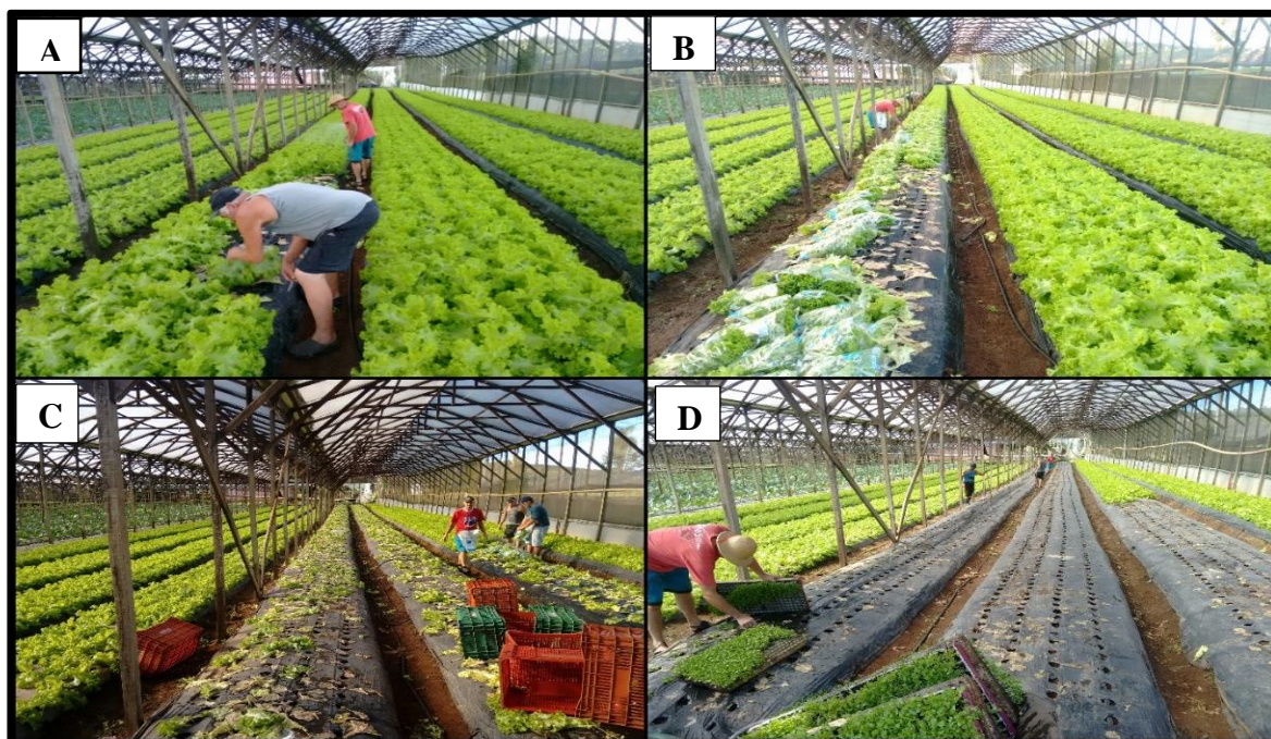
Figura 4. Sequência do processo de colheita de alface. A: corte na base da planta. B: embalagem e recolhimento do produto. C: canteiro com todas as plantas colhidas. D: canteiros limpos e recebendo outra cultura (rúcula).