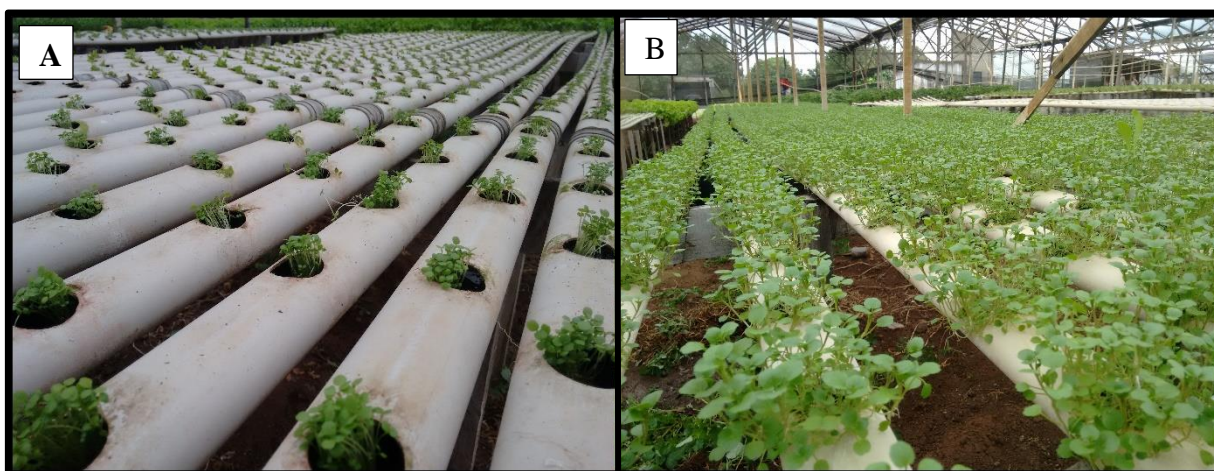
Figura 5. Mudas de agrião nas bancadas do berçário (A) e nas bancadas finais (B).

Cada bancada possuía um tanque plástico de 250 litros cada, onde era armazenada a solução nutritiva. O manejo desta solução, era efetuado com o auxílio de um condutivímetro de bolso da marca HM Digital, com o qual era feita a leitura da condutividade elétrica da solução, o que torna possível aferir a concentração de sais presentes na solução e, desta forma, repor a quantidade de sais retirados pelas plantas até os níveis tidos como os ideais de acordo com as recomendações estabelecidas. Esta atividade era realizada duas vezes por semana, durante o estágio. A troca da solução nutritiva como um todo não ocorreu durante a realização do estágio, uma vez que, os tanques eram equipados com sistema de boias, onde a água é repostada automaticamente conforme o nível de solução diminui.