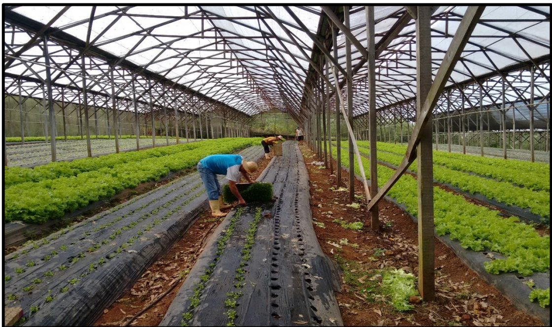
Figura 3. Transplântio de mudas de rúcula para os canteiros

da propriedade. As mudas são adquiridas em bandejas de poliestireno expandido (isopor) branco, uma vez por semana, em quantidades variadas, de acordo com a projeção de plantio feita pelo proprietário. O transplântio das mudas de alface, rúcula, agrião, espinafre, radicci e couve é feito de forma manual. As mudas são transplântadas para o solo onde existem perfurações no filme plástico de cobertura de solo, expondo o solo somente onde a planta se estabelecerá. Estas perfurações são espaçadas conforme o espaçamento indicado de cada cultura, como ilustra a Figura 3. Após o transplântio, as bandejas retornam ao produtor de mudas.