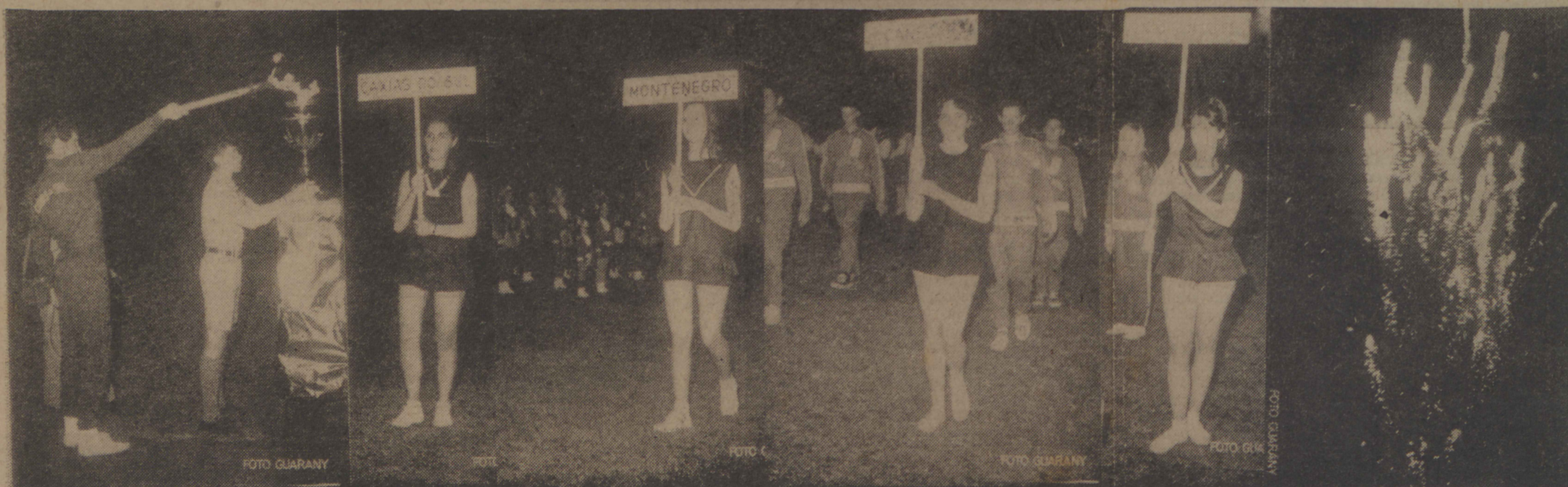
Na seqüência fotográfica acima, colhida no Estádio Alfredo Jaconí, na noite de quinta-feira última, quando da abertura dos 1.ºs Jogos Intermunicipais do Interior, vemos, à esquerda, um atleta da representação caxiense quando acendia a Pira com a chama votiva. Em seguida, as balizas das representações de Caxias do Sul, Montenegro, Canela e Bento Gonçalves e à direita, um flagrante dos fogos de artifício que marcaram a abertura do certame que está se desenrolando com grande entusiasmo e brilhantismo. — Mais detalhes na últ. pag.