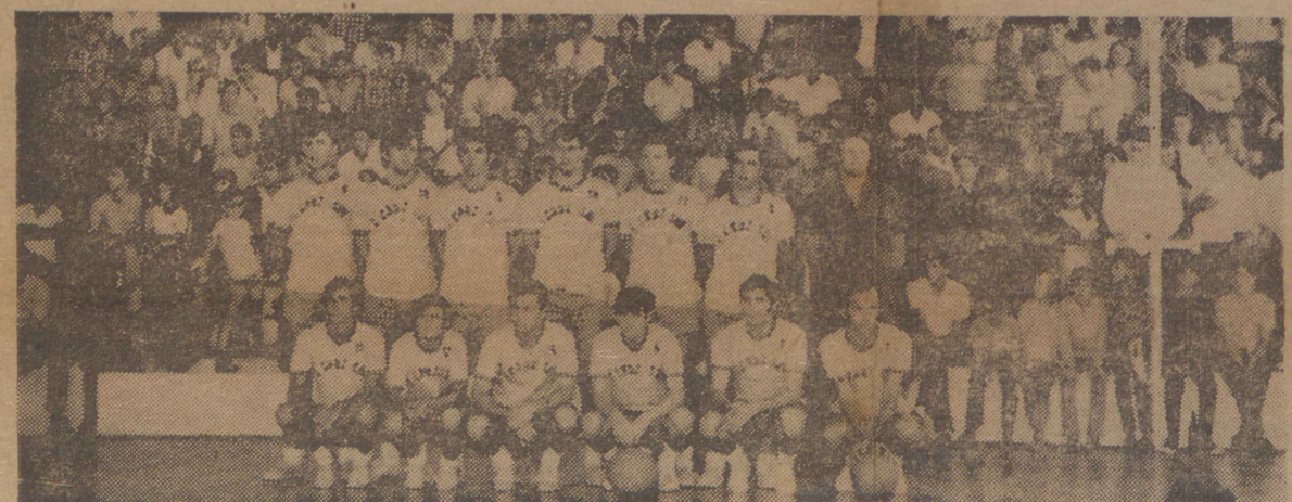
A equipe de Santa Cruz do Sul, promotora dos últimos JIRGS, venceu o certame de bola-ao-césto. Não faltou incentivo, até charanga tinha. Em Pelotas isto se repetirá?

Eis aí um breve histórico dos Jogos Intermunicipais do Rio Grande do Sul, que a cada ano que passa, crescem mais, levando nosso Estado a uma posição condizente dentro do esporte brasileiro. — CARLOS PAIM FALCETTA