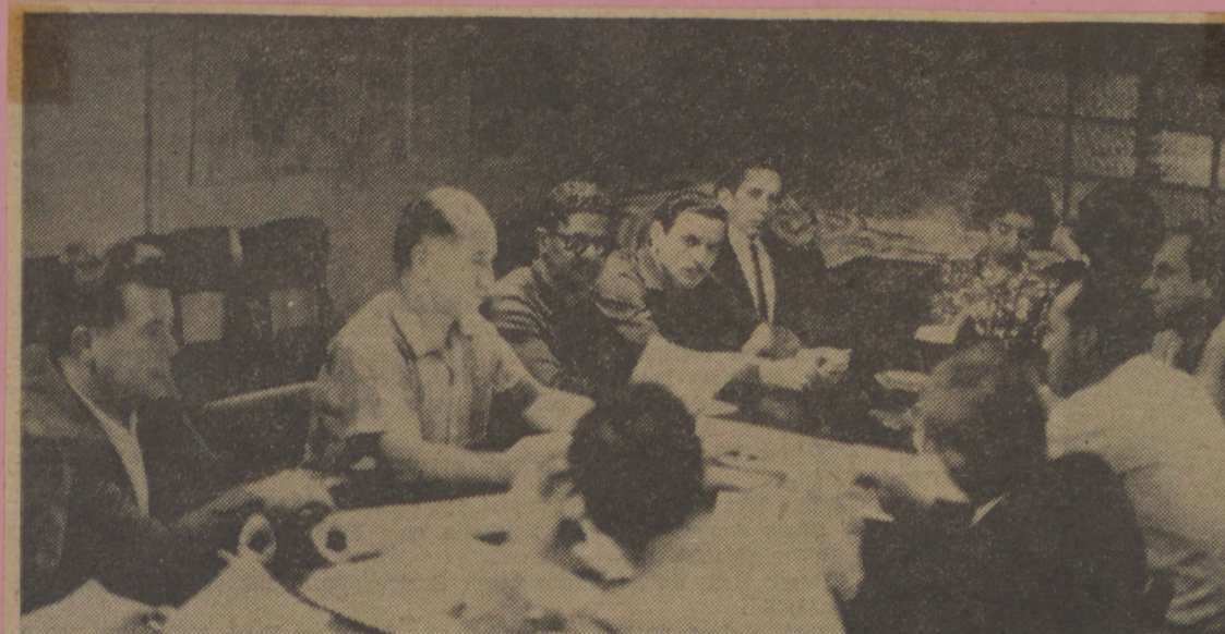
Na reunião entre diretores do DEERGS e membros do CMD de Pelotas, os IV JIRGS passaram na manhã 5/10/70