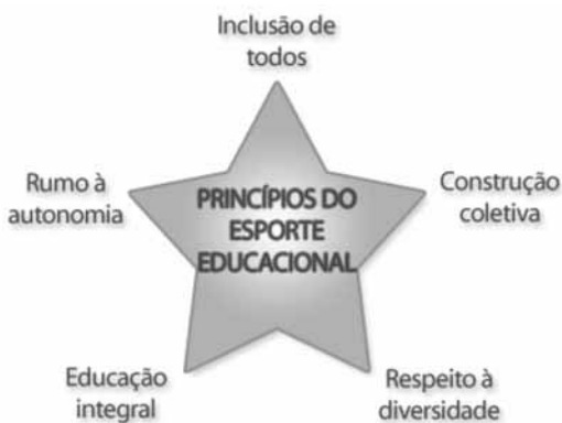
Figura 1: Princípios do Esporte Educacional

5. Rumo à autonomia: compreender a prática esportiva como ação emancipatória para a formação de um cidadão ativo, crítico e criativo.