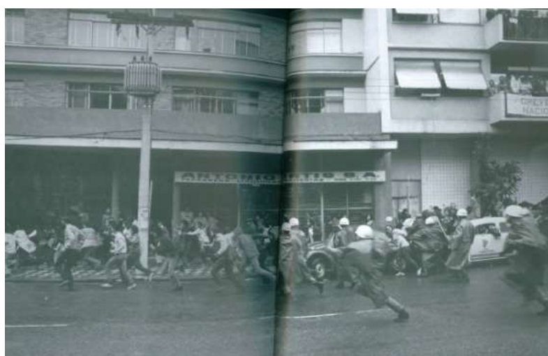
Fonte: BD ZH/Arivaldo Chaves. In: BORTOT; GUIMARAENS, op. cit. p. 240-241.

cartazes; de um ângulo superior, uma delas registrou o momento em que era feito um desenho de caveira, onde atrás dela cruzavam duas bandeiras: a do Brasil e da Argentina. Em algumas destas fotos, foi possível inferir a data do registro como sendo pertencentes ao dia 22 de agosto por meio de comparação com a fotografia de Arivaldo Chaves, da Zero Hora , na qual mostra a correria no momento em que a Brigada agride os estudantes em frente ao RU da UFRGS; entre os indícios que apontam aquela data, está a idêntica disposição de dois automóveis Volkswagen Fusca, um escuro e outro claro, respectivamente, estacionados junto ao meio-fio.