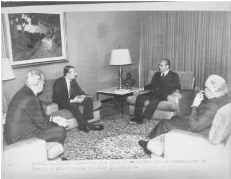
“Brasília, 19 (EBN) – Encontro dos dois presidentes com os chanceleres de Brasil e Argentina, no Palácio do Planalto”. Fonte: Arquivo Nacional , BR RJANRIO EH.0.FOT, PRP.11063.