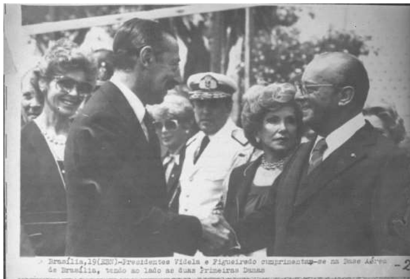
“Brasília, 19 (EBN) – Presidentes Videla e Figueiredo cumprimentam-se na Base Aérea de Brasília, tendo ao lado as duas Primeiras Damas”.

Fazia semanas que os muros de Brasília e de outras capitais brasileiras amanheciam pichados com a frase “FORA VIDELA”; a imprensa brasileira informava “que o governo argentino pediu discretamente que as palavras [fossem] cobertas” na capital federal. 127 Na manhã do dia 20 de agosto, um forte esquema de segurança foi montado em volta do Congresso Nacional, enquanto Videla era homenageado pelo legislativo brasileiro em sessão especial. O esquema de segurança “chegou ao extremo de destruir o jardim principal do Congresso, sob a alegação de que roseiras e arbustos de médio porte poderiam esconder inimigos do regime argentino”. 128 Foi registrado também pela imprensa a recusa, pelo serviço de segurança do Palácio do Planalto, dos pedidos de credenciamentos de doze jornalistas designados a cobrir a visita de Videla. 129 A sessão de homenagem lotou o Congresso, apesar de ter sido marcada pela ausência das bancadas dos partidos de oposição, contando com a presença de apenas 60 deputados e senadores, além de cerca de 50 oficiais-generais do Exército, Marinha e Aeronáutica brasileira. Apenas dois parlamentares do PP compareceram à sessão, os senadores Hugo Ramos, do Rio de Janeiro, e Valdon Varjão, do Mato Grosso, bem como Paulo Brossard, líder do PMDB no Senado, e o senador Dirceu Cardoso, ex-PMDB e