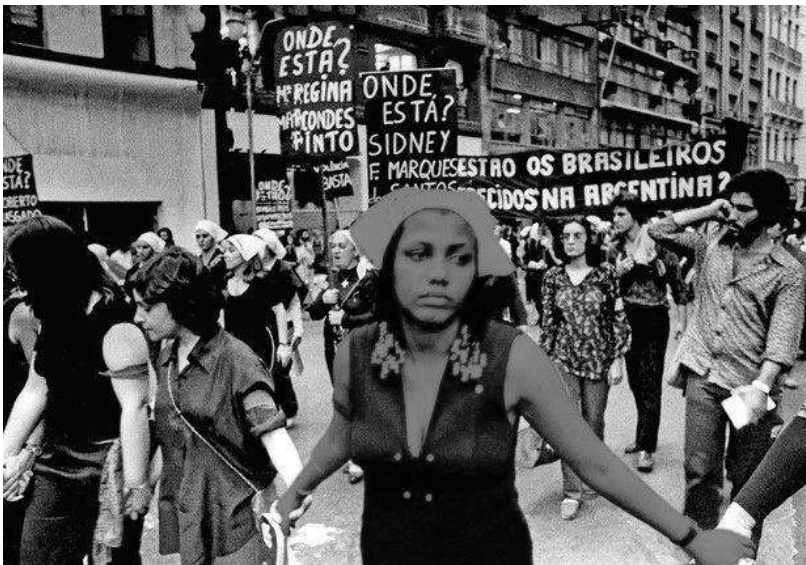
Fonte: Material Brasil Nunca Mais do Arquivo Edgard Leuenroth/Unicamp. Disponível em: < http://revistamarie Claire.globo.com/Mulheres-do-Mundo/noticia/2013/09/os-testemunho-das-mulheres-que-ousaram-combater-tidadura-militar.html >. Acesso em: dez. 2017.