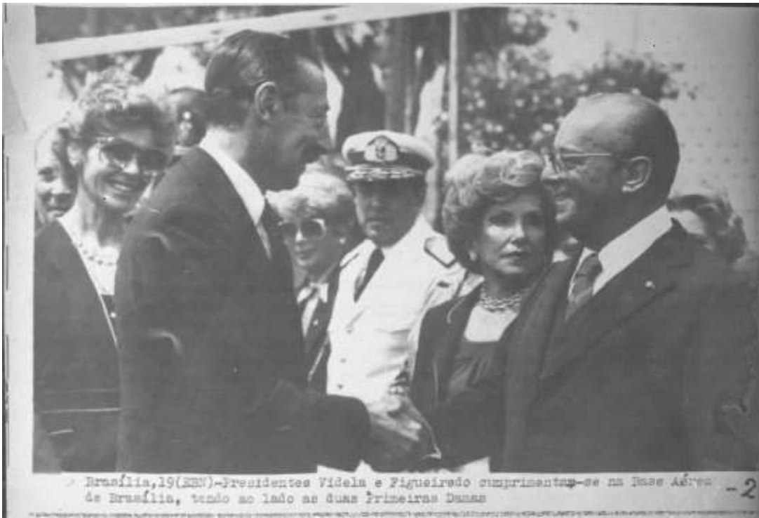
“Brasília, 19 (EBN) – Presidentes Videla e Figueiredo cumprimentam-se na Base Aérea de Brasília, tendo ao lado as duas Primeiras Damas”.