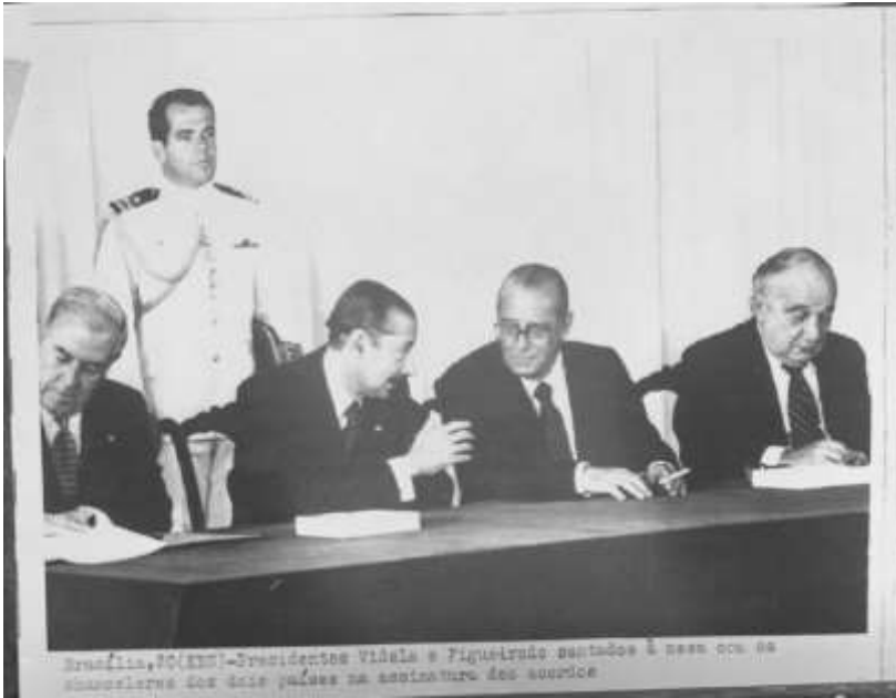
“Brasília, 20 (EBN) – Presidentes Videla e Figueiredo sentados à mesa com os chanceleres dos dois países na assinatura dos acordos”. Fonte: Arquivo Nacional , BR RJANRIO EH.0.FOT, PRP.11064.