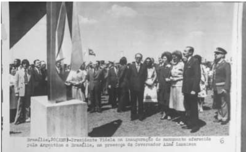
“Brasília, 20 (EBN) – Presidente Videla na inauguração do monumento oferecido pela Argentina a Brasília, na presença do Governador Aimé Lamaison”.