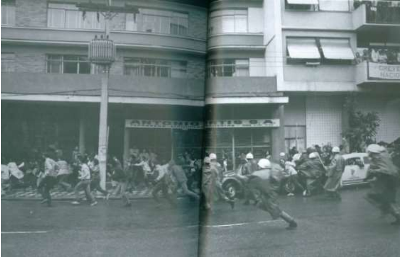
Fonte: BD ZH/Arivaldo Chaves. In: BORTOT; GUIMARAENS, op. cit. p. 240-241.