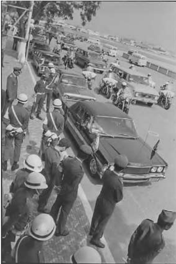
“Chegada da comitiva de Videla no Aeroporto Internacional do Galeão, Rio de Janeiro – RJ”.